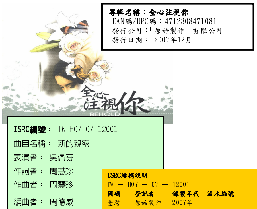
圖 3：ISRC 圖示—以「全心注視你專輯·新的親密」一曲為例

(music videograms) 的一種國際標準，不同之處在於 ISBN 是由書號中心給予每一本書編號，而 ISRC 係由 12 個英文字母或阿拉伯數字所組成（如圖 3 所示範），其作品流水號，則由登記者自行給號。（注 2）在書號中心多年努力下，更將經業者授權同意下約 1 分鐘左右的試聽曲，於「國際標準錄音錄影資料代碼查詢系統」（ http://isrc.ncl.edu.tw/ ）上，為讀者提供最新音樂出版資訊。