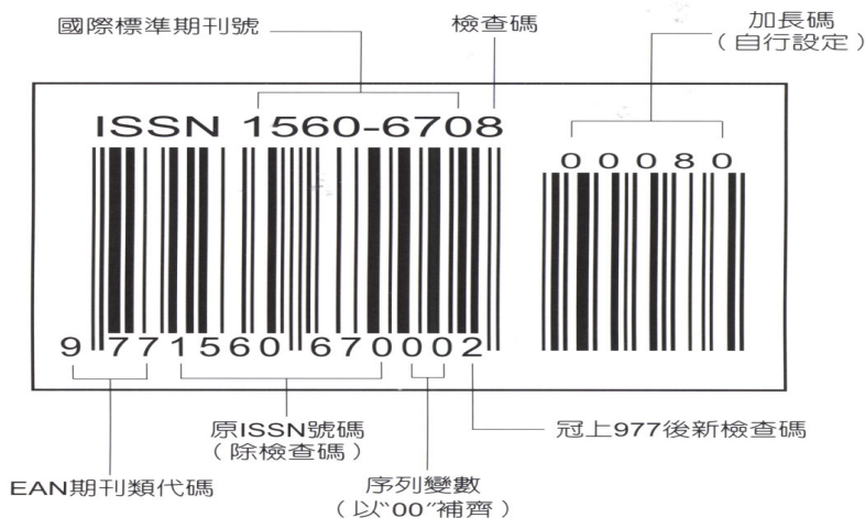
圖 4：ISSN 及其條碼化圖識 — 以《全國新書資訊月刊》(ISSN 1560-6708) 為例