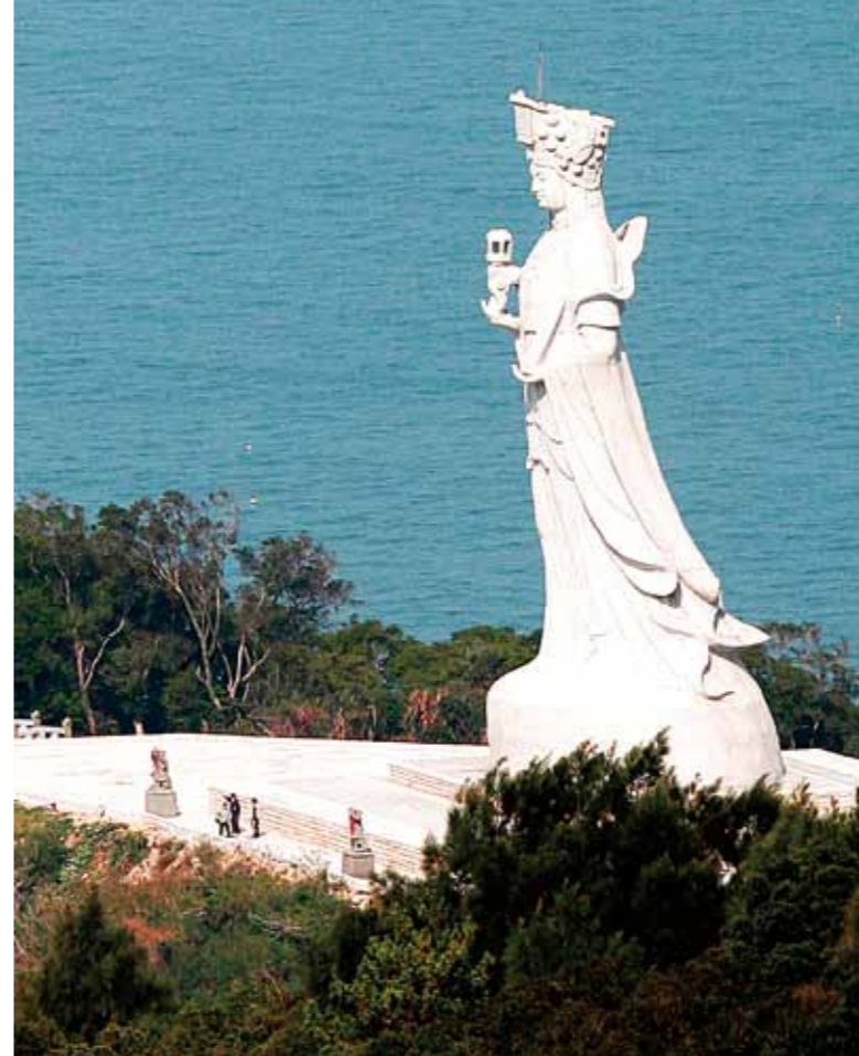
➤ 全世界最高的媽祖巨神像。

傳說媽祖的衣冠塚就在南竿馬祖村的馬祖天后宮中，當年林默娘投海尋父，遺體隨海漂流到馬祖村，先民為了感念她的孝行，便在此立廟祭