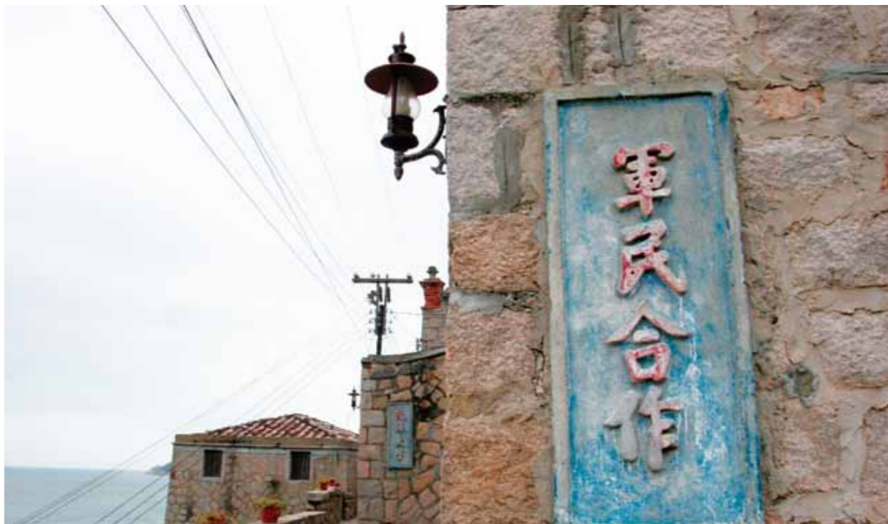
➤ 芹壁聚落牆面布滿軍事標語，作為戰令宣導用途。

全長300公尺，沿途有8個孔道，每條皆通往海邊，不僅用以防衛敵方，此坑道也是部隊士兵生活起居的場所。