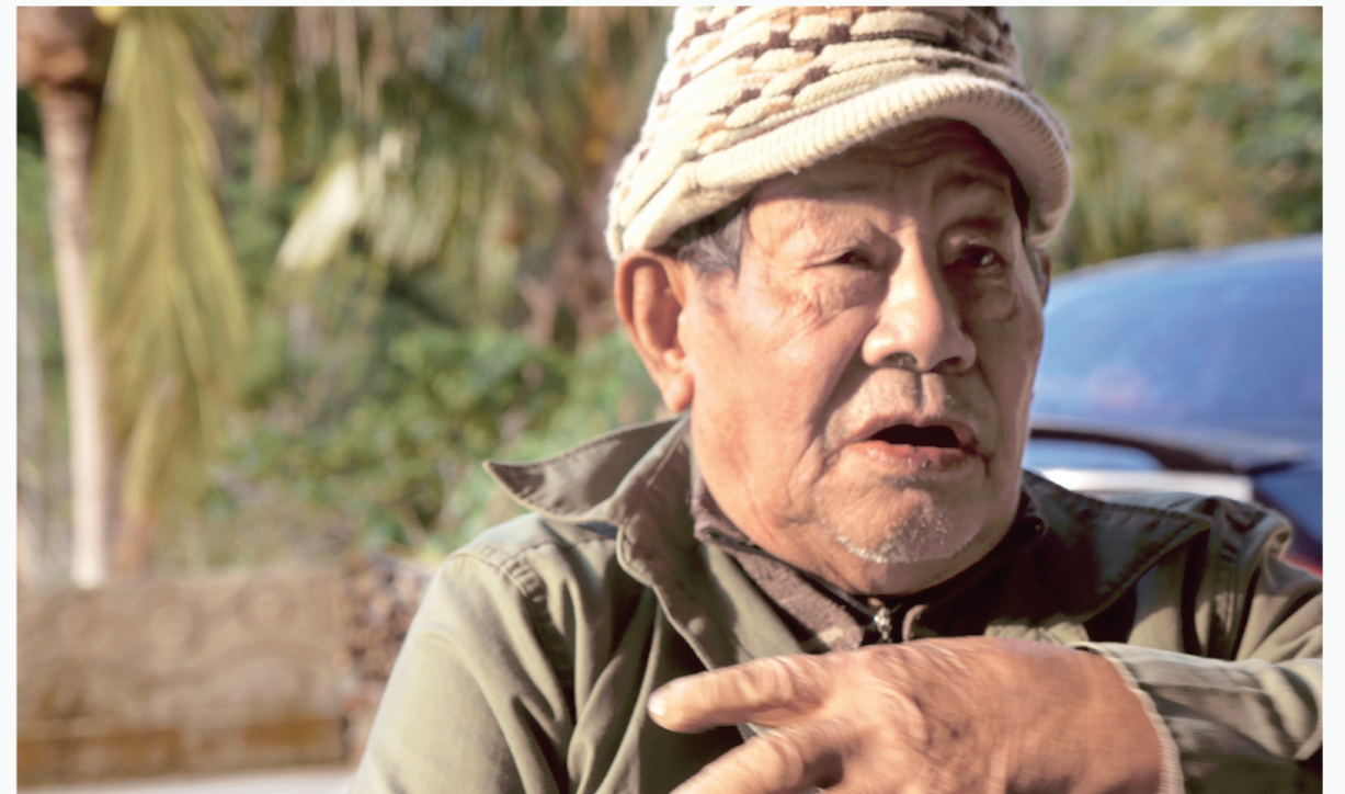
部落中的原住民交換著記憶中的故事。

海拔大約370公尺的風母山和海拔約450公尺的五重溪山相峙形成天險，陡峭絕壁難以通行，1874年5月8日，3,600名日軍進攻恆春，於5月22