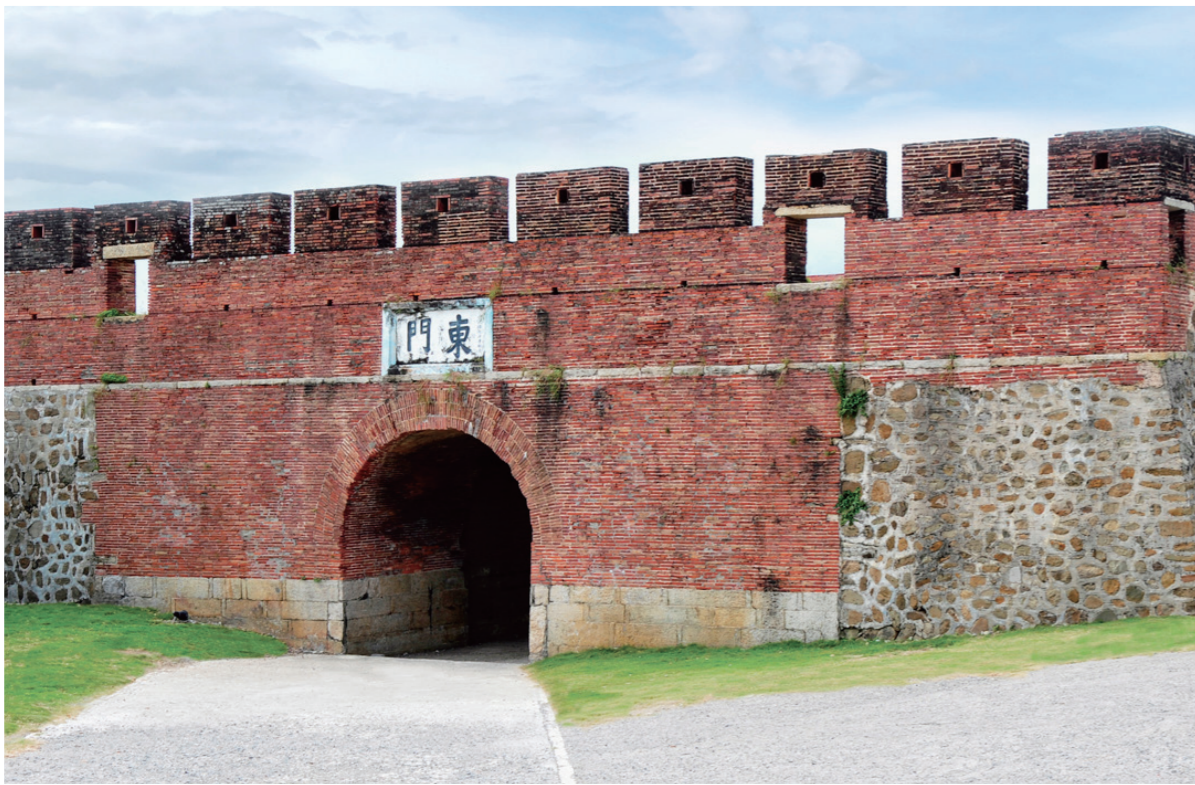
恆春城門真正的用途是為了防範原住民。

通往牡丹水庫的途中，原住民式的傳統建築隨處可見，道路旁有排灣族居住的部落，遊客可以欣賞到悠閒慢活的部落風情、傳統建物、手工藝品展售……沿途還有許多排灣族風味餐的美食店家，喜歡原住民料理的遊客千萬別錯過。