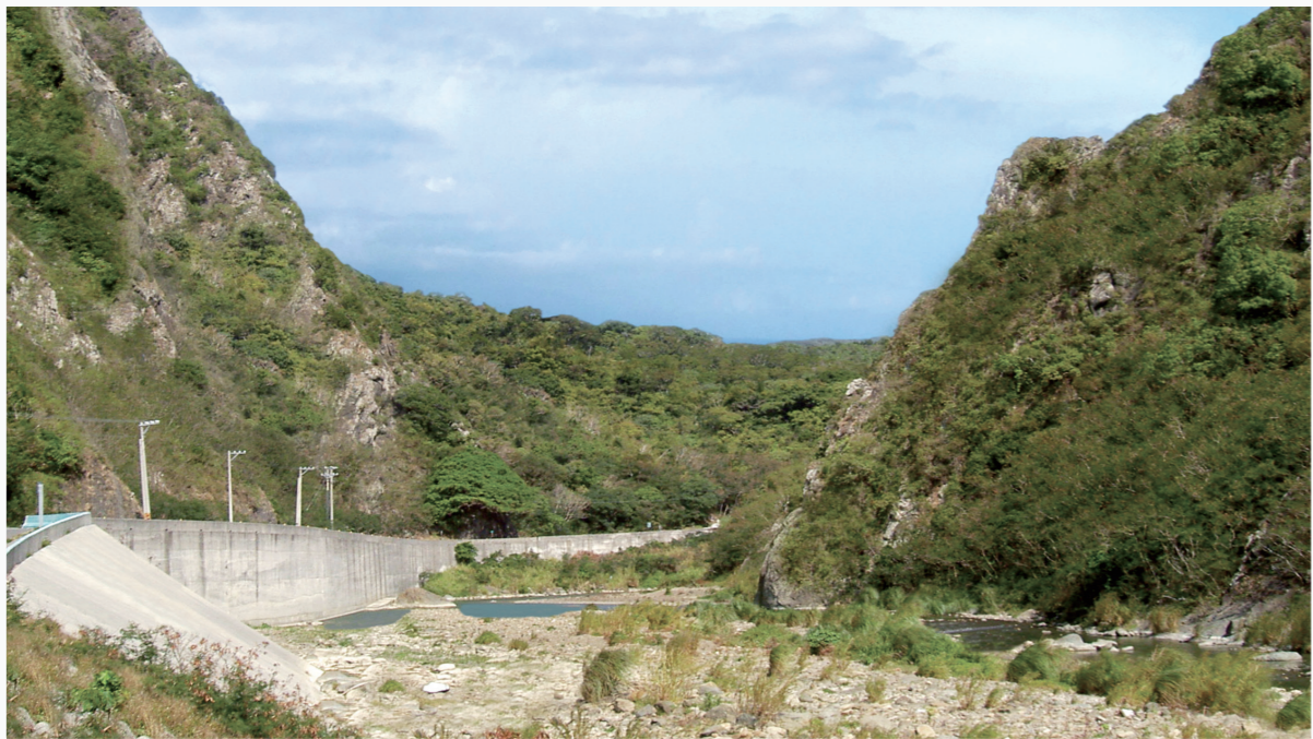
「古戰場」是日軍與原住民對峙的隘口。

許多人習慣直奔墾丁，擁抱藍天大海；《海角七號》熱潮後，恆春古城也吸引了國人的目光；但在路途中，你可能錯過了一處集歷史與美景的牡丹鄉。