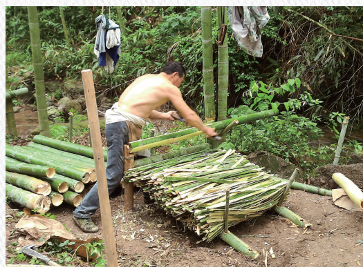
8 傳統造紙削竹工序。