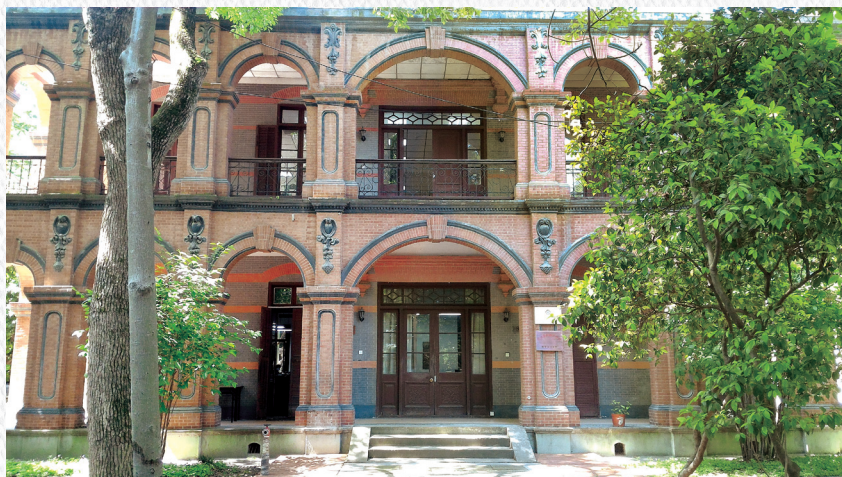
9 古籍修復中心位於浙江圖書館孤山路古籍部紅樓館舍二樓。

了「國家級古籍修復技藝傳習中心浙江傳習所」，邀請中國大陸國家圖書館資深古籍修復專家胡玉清擔任導師，以古籍修復中心團隊為班底，傳授古籍修復技藝，讓淡去的書香再吐芬芳。