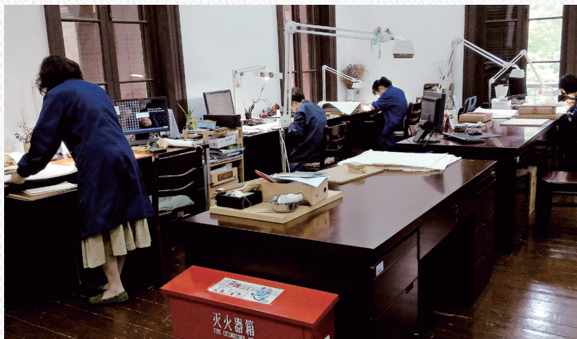
11 浙江圖書館古籍修復中心一隅。