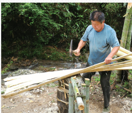
7 傳統造紙拷白工序。

修復人才的培育、傳承是建設古籍保護最基礎的工作。浙江圖書館與浙江藝術職業學院合作辦學，由古籍修復中心提供師資，並設立相應的教學實習基地，積極培養接班人才。今年5月初，更設立