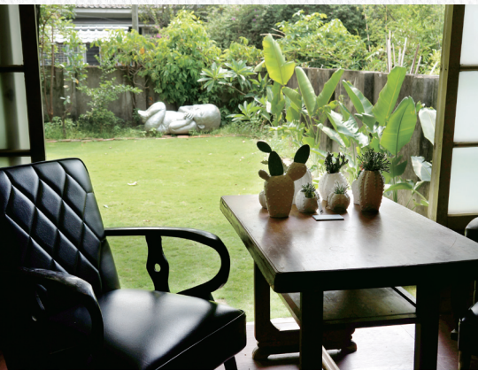
5 公園路 321 巷藝術聚落，假日開放民眾入內參觀，享受片刻的幽靜。

中西區圖書館、台灣文學館與葉石濤文學紀念館三棟建築共同擁有一座美麗的戶外中庭，園林中有兩棵樹齡 65 歲的南洋杉，歷經多年風雨考驗，高約 10 公尺的兩棵樹很有默契的同向彎曲，被地方人士為「夫妻樹」，因此，到了這