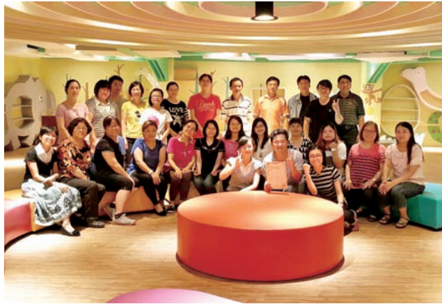
5 彰化縣文化局圖書資訊科同仁合影。

每到週末，二樓的兒童閱讀區及嬰幼兒閱讀區擠滿家長和小朋友，中英文書籍及繪本一應俱全。兒童閱讀區經過改造，空間寬敞，恐龍、大象造型書架相當吸睛，溫暖的閱讀環境，讓讀者願意駐足。