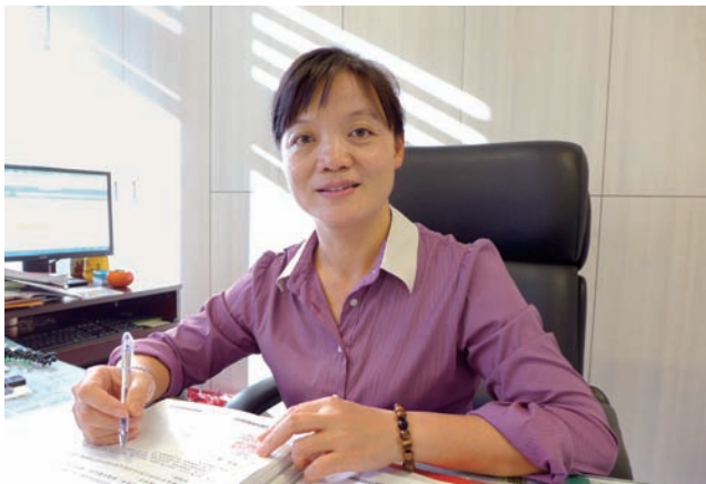
4 彰化縣文化局局長吳蘭梅。