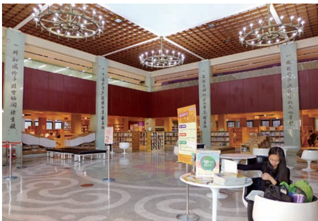
6 整修後的彰化縣立圖書館變得更為更寬敞。