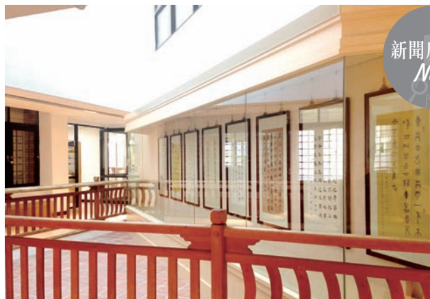
7 運用迴廊作為展示空間。