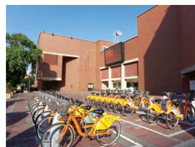
9 圖書館外設置 YouBike。