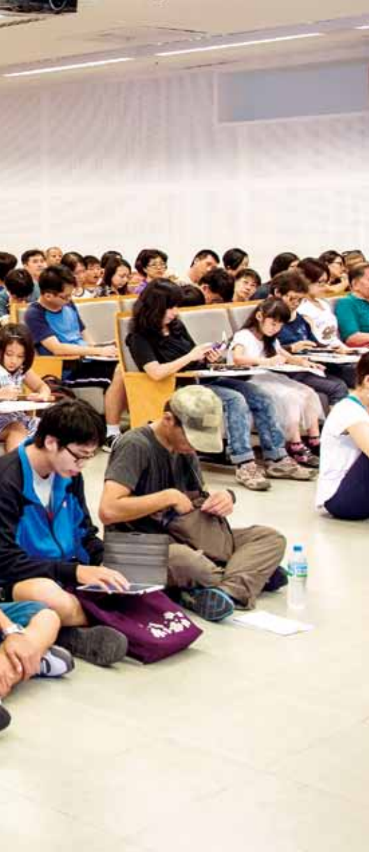
大東講堂場場精采，經常聽眾大爆滿。

隸屬於法國 Annecy 縣，市中心有棟結合市政辦公室、藝文中心和圖書館的建築，兩年前，有 80 幾人同時帶著薩克斯風進入圖書館內進行一場音樂快閃演出。圖書館內的讀者都大感驚豔，有民眾在 Facebook 寫下感受：音樂來到讀者面前，書本也跟著跳著舞，圖書館的氣氛光亮了起來……，文學的話語和音符讓我共享這個令人驚喜的歡樂時刻……謝謝你們，圖書館和音樂藝術家們！