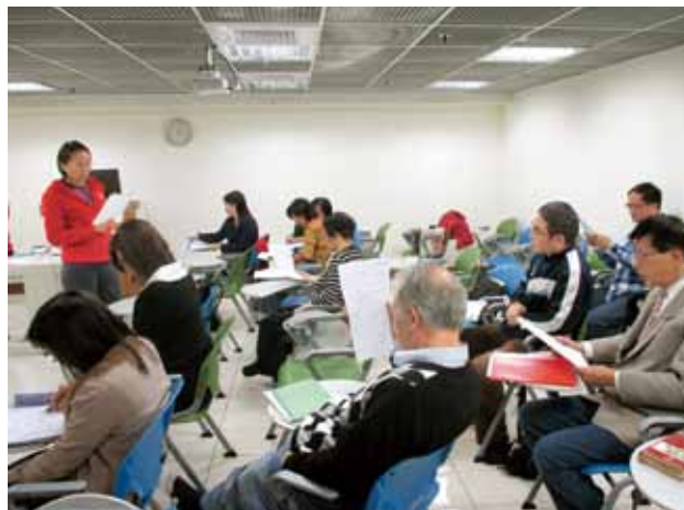
在陽明分館學外語的民眾，年齡層分布很廣。