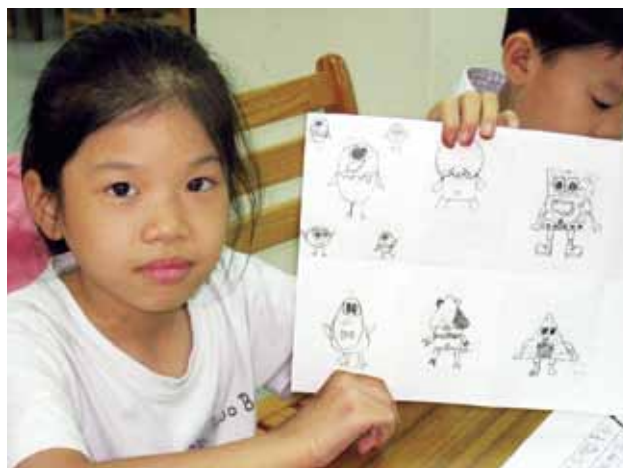
喜歡漫畫的小朋友在東東漫畫技法親子讀書會中學習基礎技法。