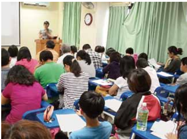
滿堂學美語的學子，這裡不是補習班，是寶珠分館。