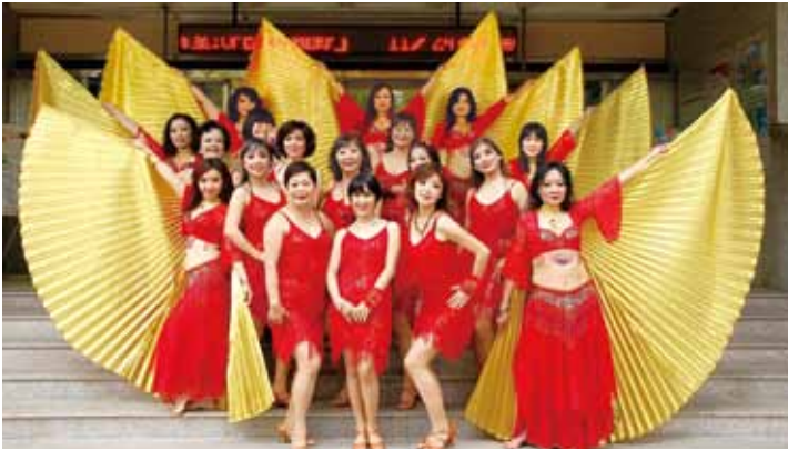
左營分館異國風舞蹈班廣受歡迎，許多婆婆媽媽都表示，參加舞蹈班後不僅改善腰痠背痛的毛病，體態也變得更迷人。