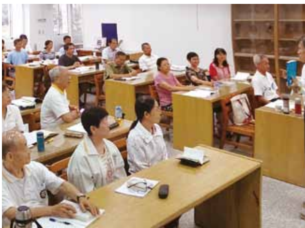
「讀老子練功夫」除了讀經還配合外內丹功實練，學員身心皆能受益協調。