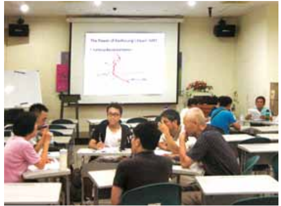
高雄文學館「英文讀書會」希望民眾建立英文閱讀、討論的能力。

立異國風舞蹈班，目的是增進民眾身體健康，更讓大家了解世界特色風情、提升圖書使用率。