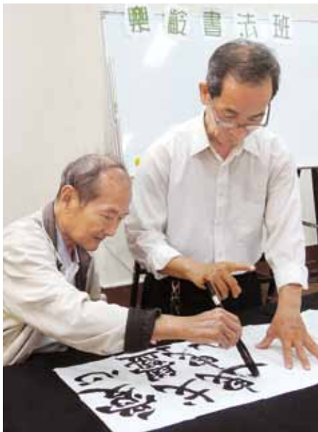
三民分館書法研習班已成立十多年，從「提、按、勾、回」的習字過程中，學員體會到漢字在書法的筆鋒下有著柔中帶剛之美。