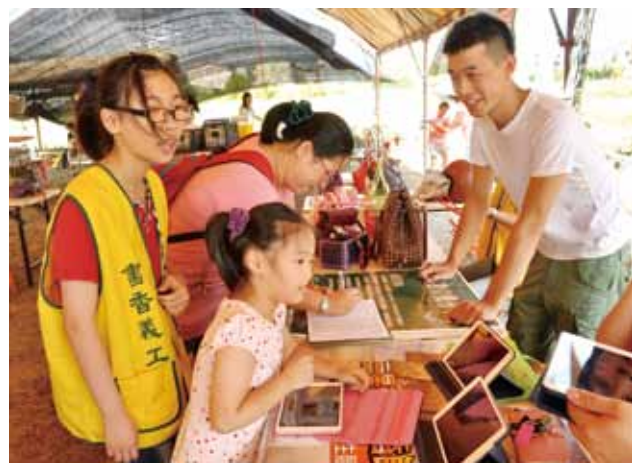
米香節三星鄉立圖書設置攤位舉辦平板繪畫活動。