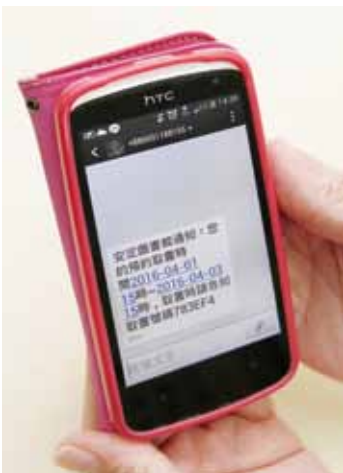
臺南安定區民眾憑手機簡訊取書碼即可至區內便利超商取書。