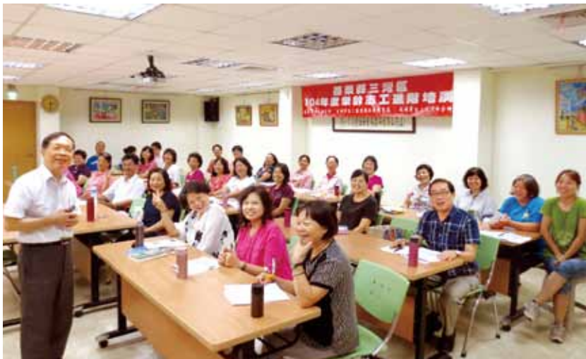
樂齡志工培訓課程。(三灣鄉立圖書館提供)