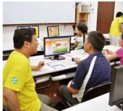
設置農民部落格，將地方農特產品發揚光大。