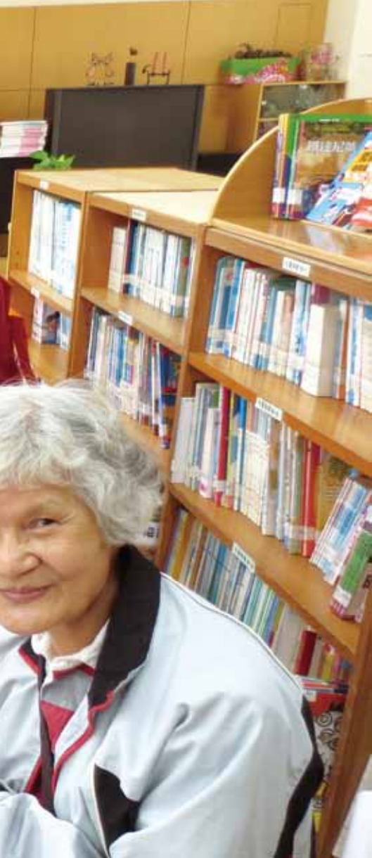
「環保書袋DIY」邀請長者發揮縫紉好手藝。