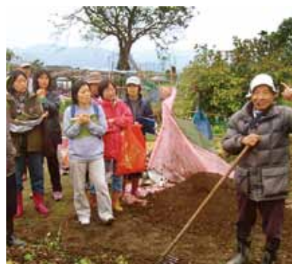
學員現場觀摩有機農耕。

響了地方名聲，三星圖書館開始思考，該如何突破局限擴大服務範圍？於是將鄉長打造「有機農業鄉·美麗觀光城」的理念，融入圖書館經營特色中，進一步透過觀光元素的導入，來帶動地方特色產業的發展。