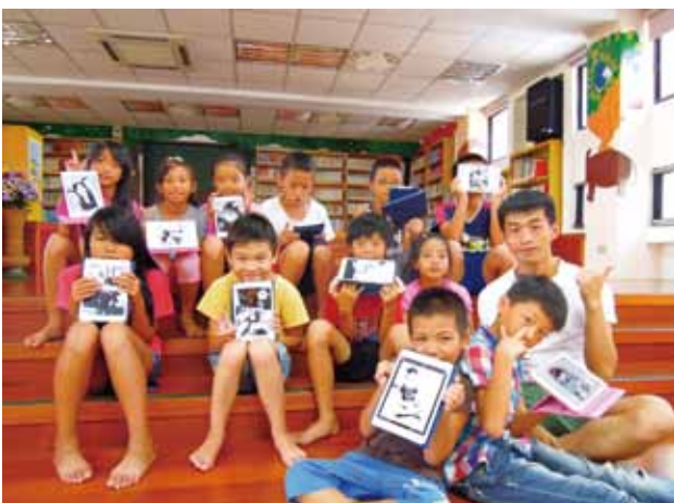
小朋友體驗用平板製作漫畫。