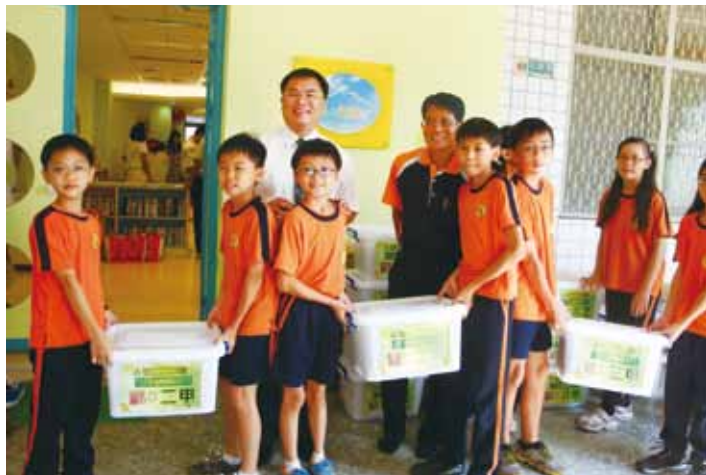
臺南市安定區圖書館推廣「書香安定·喜閱傳情」活動。

公共圖書館為地方民眾最容易親近的終身學習場域之一，與社區之間存在著密不可分的連結關係。近年來，公共圖書館致力與社區連結，無論是彰顯產業特色或建立溝通管道，圖書館總是試圖透過多方面的合作與活動，建立圖書館與社區的夥伴關係。