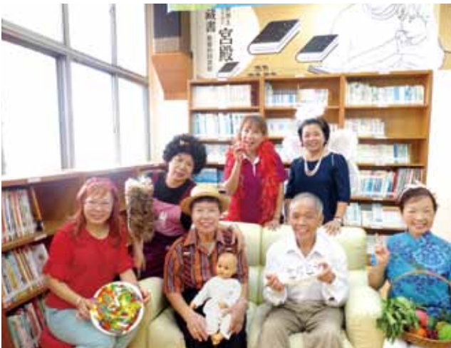
樂齡長者參與表演話劇。