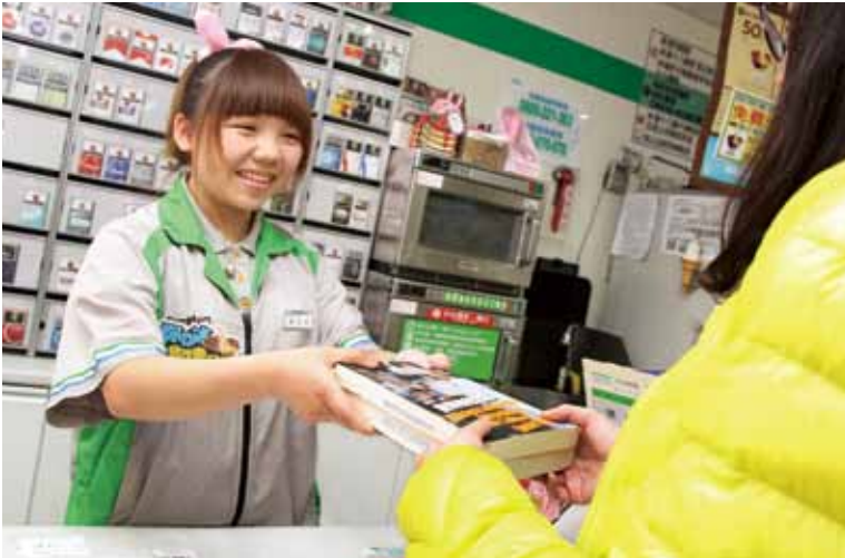
臺南市安定區圖書館推出全國首創的「書香安定·便利閱讀」超商借還書服務。