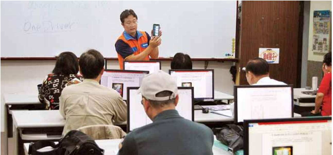
智慧型手機課程民眾認真聽講。