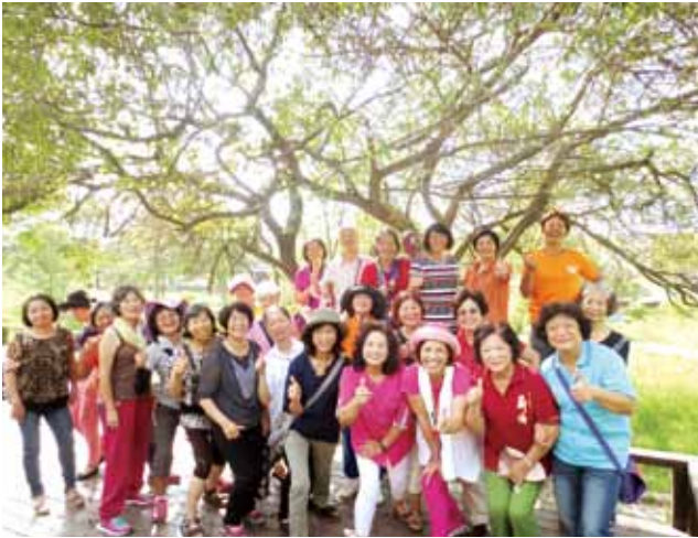
樂齡長者參與家鄉踏查課程。