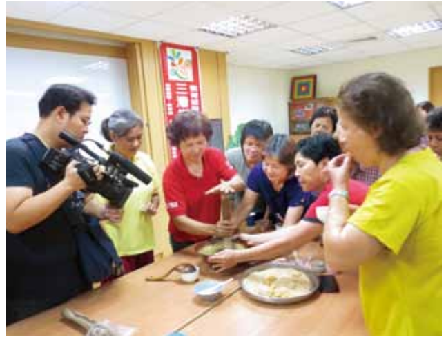
樂齡長者體驗客家擂茶製作。