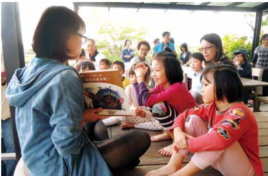
毛毛蟲兒童哲學基金會說故事活動。

管制的行政成本增加，民間單位的工作成本也增加，自然就少人敢去承擔政府業務，很多問題在此；否則，臺灣是軟實力很大的地方，人又聰明，民間應該能夠發揮更大的效益。