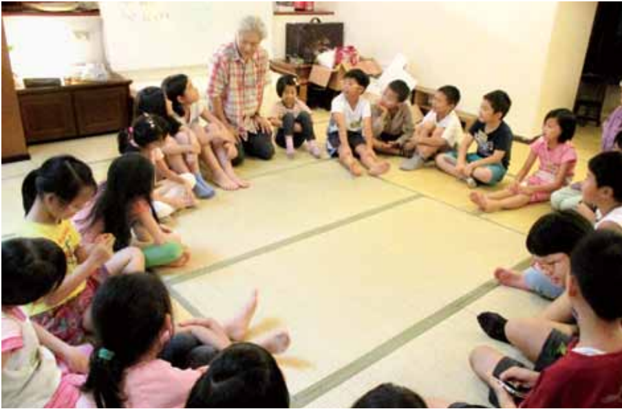
毛毛蟲兒童哲學基金會致力推廣閱讀活動。