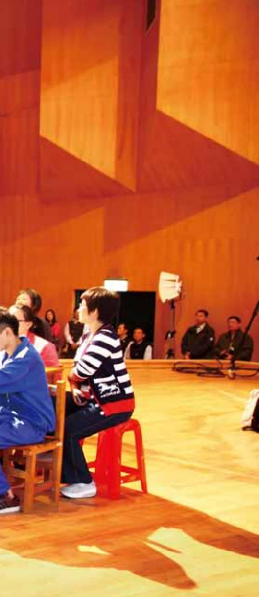
天下雜誌教育基金會「國際閱讀教育論壇」，幾乎場場爆滿。