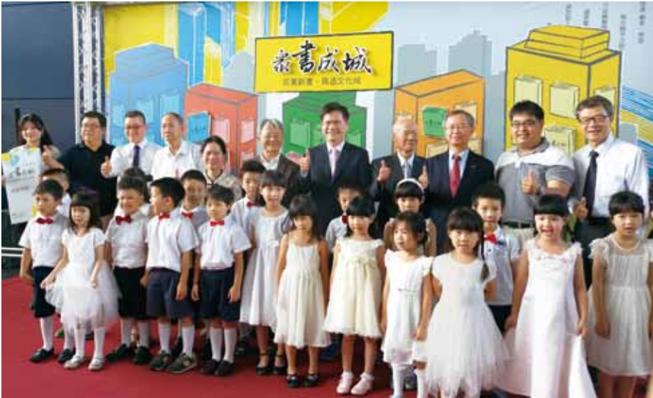
臺中市「眾書成城——百萬新書·再造文化城」募書活動。