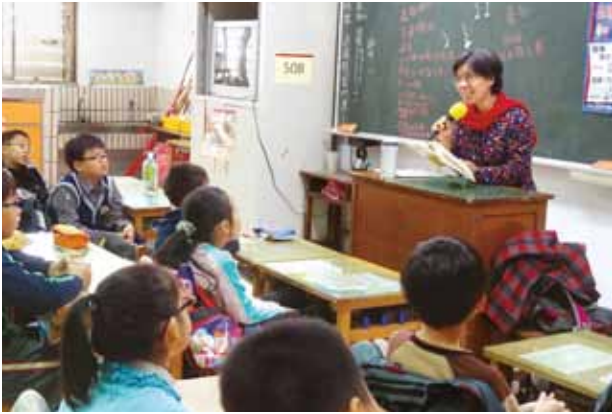
貓頭鷹親子教育協會送「故事便當」進校園，以「朗讀」餵養孩子。