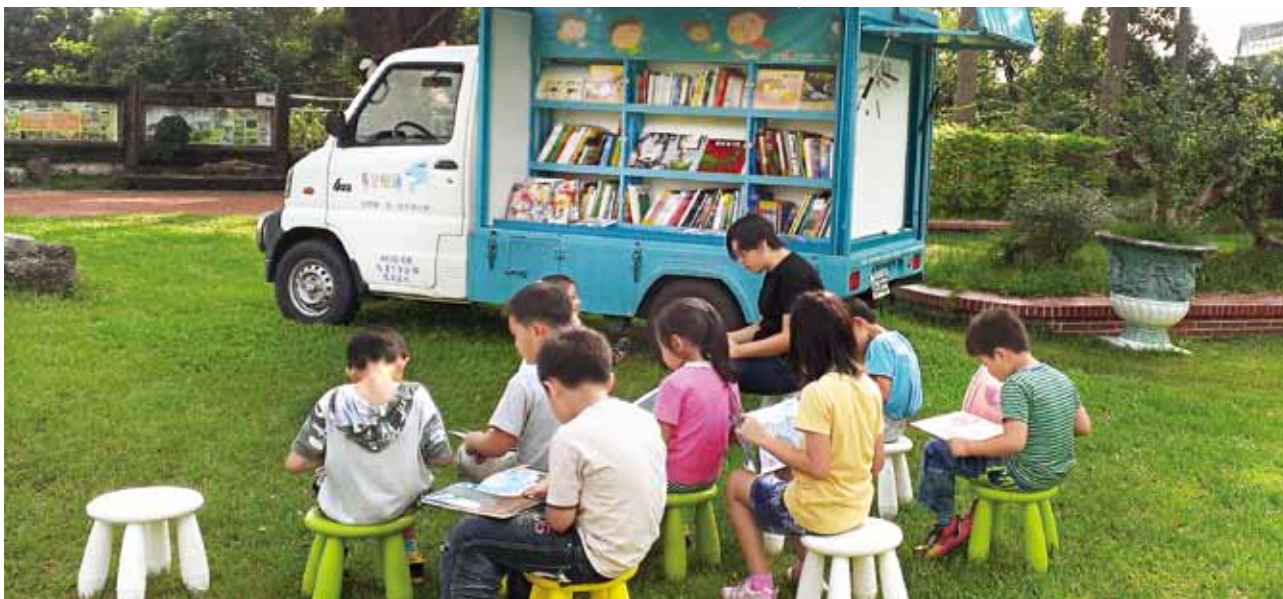
天下雜誌教育基金會「閱讀巡迴專車」，提供學童不同的閱讀體驗。（天下雜誌教育基金會提供）