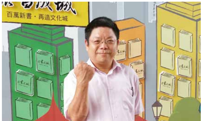
臺中市政府文化局副局長施純福。