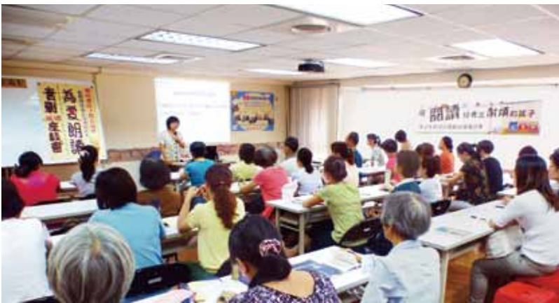
貓頭鷹親子教育協會舉辦「用閱讀培養出耐煩的孩子——陪孩子悅讀趣實戰巡迴講座」，吸引民眾踴躍參加。