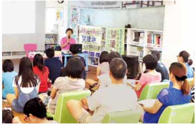
貓頭鷹親子教育協會到臺東縣關山鎮立圖書館舉辦「用閱讀培養出耐煩的孩子——陪孩子悅讀趣實戰巡迴講座」。