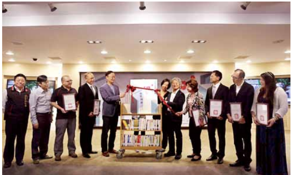
臺中市立圖書館舉辦「開卷·開運——中市圖書抽大獎」活動。

認為一件事只有兩種抉擇，沒有中間地帶，不是你的，就是我的；但是一定有第三條路可以走，必須找到一個彼此都認同、可行的方式，而雙方良性的溝通就顯得格外重要。如果只是站在自己的角度相互抱怨，「不行啊！我沒辦法配合你，」永遠無法解決問題。他強調：「我們不要談問題本身，要思考用什麼辦法來解決這個問題，就算有困難，『總是有辦法可以想』。」