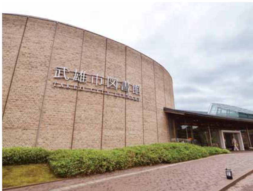
日本九州佐賀縣武雄市圖書館。

提到日本九州佐賀縣，臺灣人心中可能立刻浮現《佐賀的超級阿嬤》，這本日本作家島田洋七的自傳式小說，在臺灣熱賣超過 20 萬本，改拍成電影，一樣夯到不行。不過，佐賀可不只有阿嬤，位於佐賀縣西部的武雄市，除了有知名的溫泉之外，還有一座特別的圖書館——武雄市圖書館，吸引許多國內外遊客前來朝聖，火紅程度一點也不輸人氣景點。