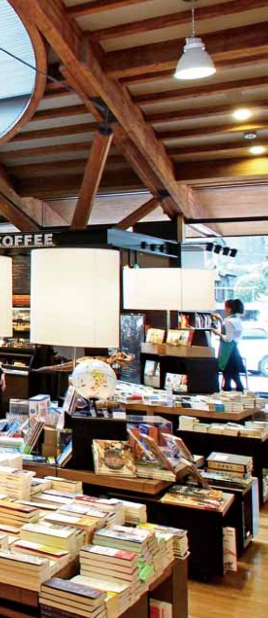
武雄市圖書館融入書店的设计概念。