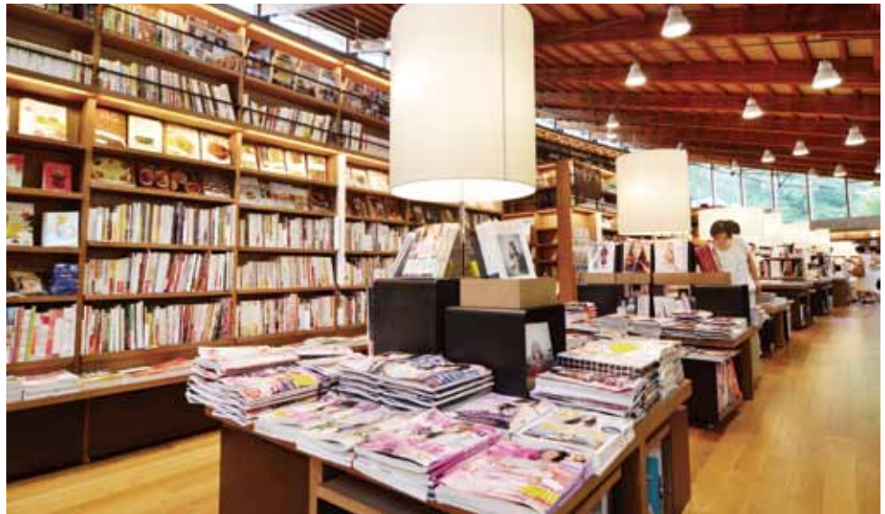
圖書館空間具時尚設計感。

流通，更可以從一個展演場地來做全新思考，成為一個更開放有容的空間，迎接讀者的來訪。」他也期許，現代的圖書館經營模式應有更大膽創新的嘗試。