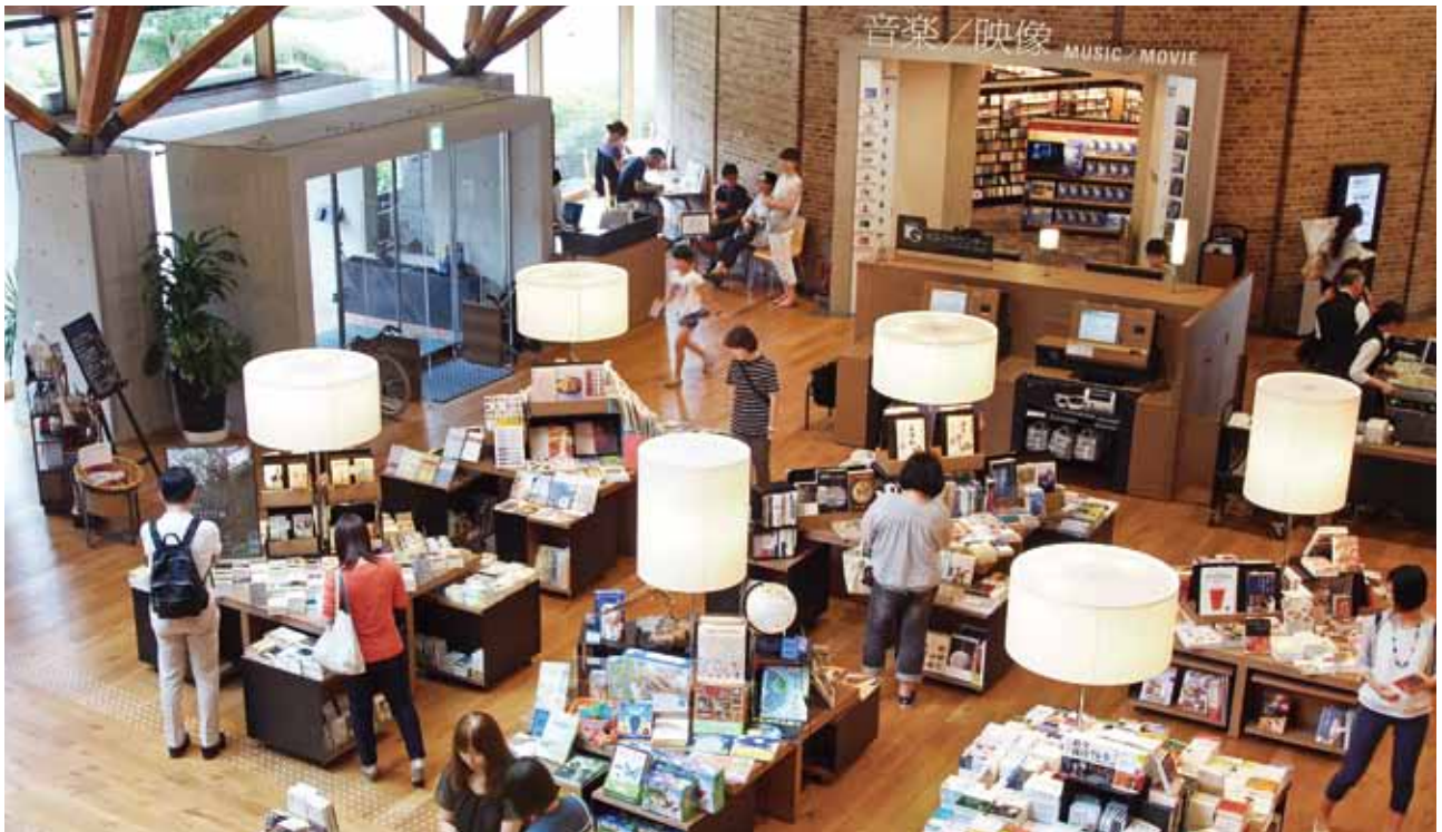
武雄市圖書館成為熱門觀光景點。