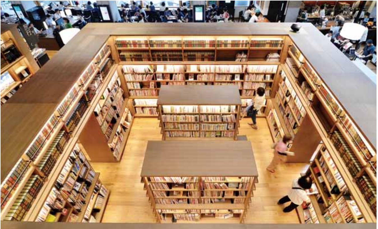
圖書館巨大的書架像是被書的宇宙環繞。

CCC 管理圖書館的想法，沒想到與增田社長一拍即合，很快就促成這樁合作，而 CCC 也成功將在蔦屋書店打造的現代「文青」閱讀習慣引進武雄市圖書館。