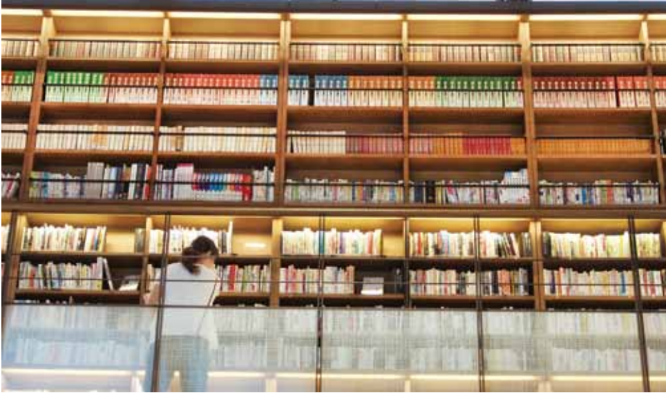
雜誌街的設計構想是武雄市圖書館的特色。