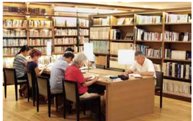
圖書館營造溫暖的燈光氛圍。

式，也觸發更多人討論指定管理者制度，日本圖書館協會在2013年就提出由大企業經營並不會讓地方受益，器材或人力都直接引進在東京的母公司資源，並認為圖書館應該是市民的特權，開放外人將產生失去圖書館功能的疑慮。除此之外，為了收益，販賣的書愈來愈多，排擠到圖書館應該提供的公共資源。近幾年引起各方質疑的是武雄市圖書館的選書標準，包括選了關東地區的美食書等等，讓市