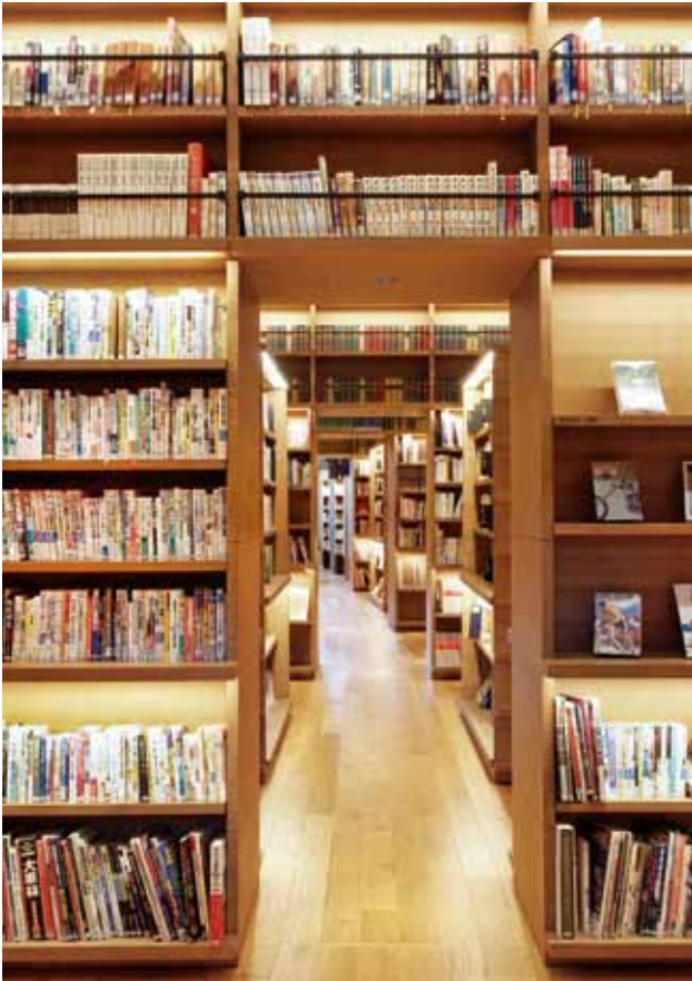
書籍的陳列導入書店擺設模式。