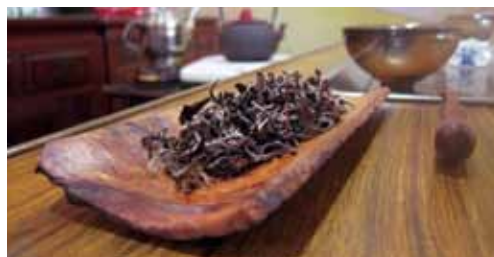
櫻花樹皮製的茶盒。