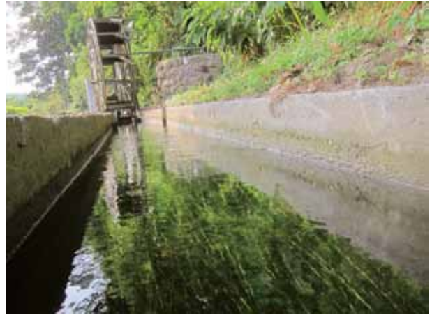
清澈溪水沿著肚兜角步道潺潺而流，偶見魚蝦嬉於水草之間，頗為心曠神怡。

步道支線還可通到一古色古香的老建築「崇仙宮」，相傳曾有白鬚老翁拄著拐杖在此行走，但只有小孩子看得