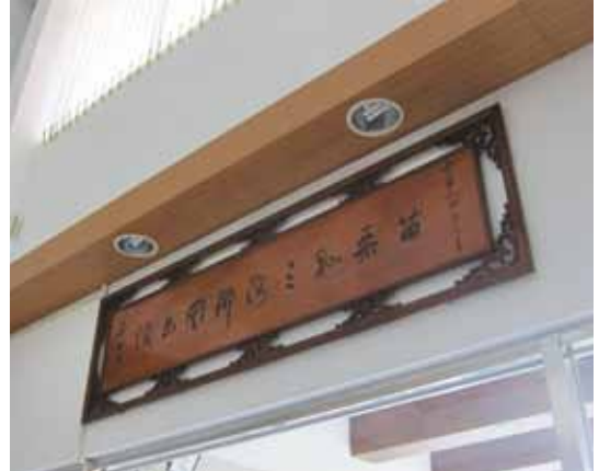
大門上方的匾額，竟是知名書法家于右任墨寶。

文史學家張紹鵬口述了一段鄉野傳說，道光6年（西元1826年），淡水同知李慎遺出訪至現今苗栗北端，見當地地形奇特，李慎遺略懂堪輿學，推測此地是風水絕佳的「螃蟹穴」，必出大人物。他敬畏心起，連忙下轎步行，但走到高處回頭一看，他便放心了。原來，對面一座山頭雜草不生、山體赤紅，當地人俗稱它「火火山」，因為螃蟹怕火，這螃蟹穴便被火火山給剋住了。後來李慎遺在火炎山上建了一座惜字亭希望能夠制煞，不管效果如何，「文官下轎、武官下馬」已成為當地耆老津津樂道的趣談。