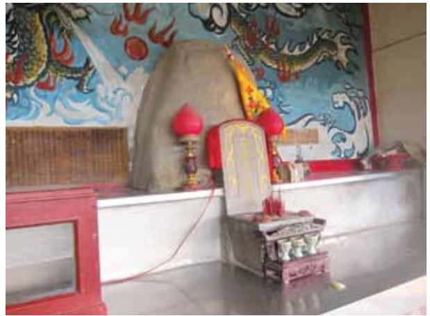
祠內供奉一顆半橢圓巨石，祠旁解說牌上說這是「石母」。

到，鄉民認定其為仙人，加上該地古有甘泉從石縫中流出，傳能治百病，仙人、仙水堪稱二奇，鄉民便在泉源上方興建崇仙宮奉祀，後來這裡成為私人祠堂，而奉祀的神祇便被移至三灣國小前的五穀神農廟了。