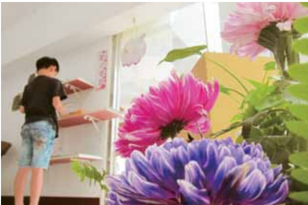
綴以當地民眾送的花、幾件精巧擺飾、落下幾張椅便是一個舒服的閱讀角。