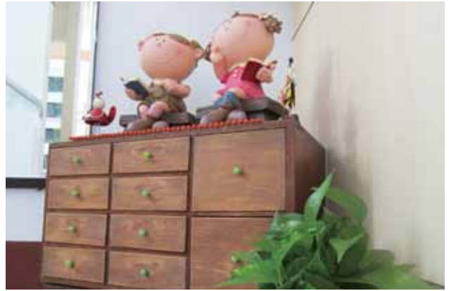
圖書館一樓與二樓間的樓梯也有許多巧思，看得出這是鄉公所舊式的公文櫃嗎？