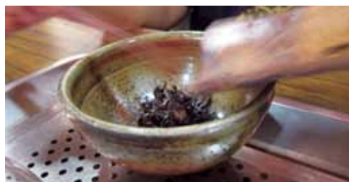
大碗泡茶，將茶葉倒進大碗中，再注以滾燙熱水。