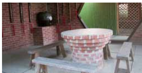
以前農業社會交通不便，從這一庄到下一庄都得靠一雙腳長途跋涉，客家人好客，會在途中涼亭擺置茶水於大甕中，供路人解渴，這就是「奉茶」的源由。