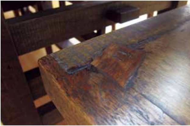
在木藝界，林耀明作品以「嵌」的元素最為人熟知。