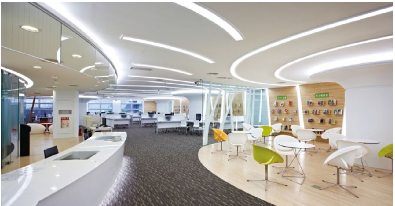
中興大學圖書館「興閱坊」是一處多元學習的共享空間。

刊。這種被迫購買不需要的產品、被剝奪選擇權的情形，也只是電子資源無法完全取代紙本館藏的因素之一。另外還有技術平臺的建立、軟硬體的安裝、書目記錄的建立、資訊的更新、資訊的可及性與可用性等等，都是圖書館引進電子資源時不得不考量的要項。