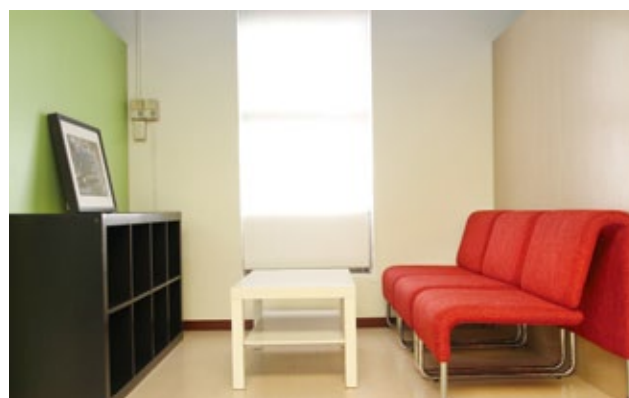
埔里鎮立圖書館青少年區採用非常亮麗炫酷的紅、黑、果綠等年輕色彩。