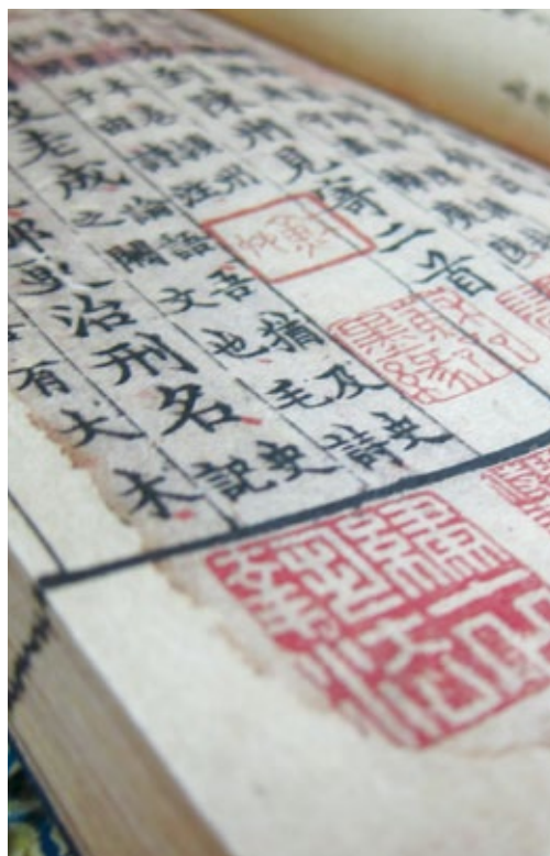
復刻版的《註東坡先生詩》焦尾本，古籍的流通包含了俗本、孤本、秘本以及藏本，而所謂的焦尾本是火燒餘燼損傷之書的雅稱。