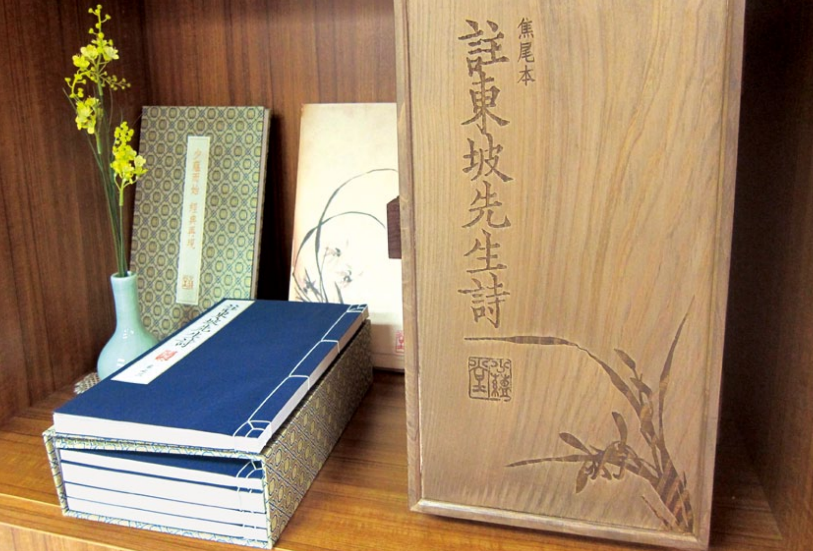
《註東坡先生詩》焦尾本曾在國家圖書館的善本室展出，除了裝禎精美，還有專屬木製書櫃相佐，更顯典雅。

態有所了解，並能掌握選擇工具。此外，圖書館員還需要懂得洽談合約、熟悉相關法律條文、有良好的溝通能力，更需要對電腦網路相關知識與技術有更多的認知，包括硬體、軟體、網路通訊及網站設計管理。這些技能的要求，對傳統無其他學科背景的圖書館員實為極大的衝擊。另一個電子資源採購的重要趨勢是「聯盟」，以集結其他圖書館共同採購的方式達到資源共享、合作館藏發展的目的。只可惜廠商為了利潤考量，通常以授權合約限制圖書館對電子資源的利用。