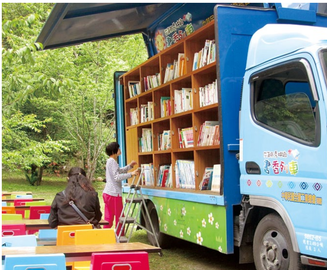
秀林鄉立圖書館打破有形的藩籬，透過行動書車推廣館藏資源。

的讀者都可以透過一個全球性的資訊基礎建設找到所有想要的資料，而不受語言或是資料形式的限制。在圖書館館藏發展方面所引發的趨勢，便是「行動在地化，思考全球化」理念的實踐，圖書館館藏的發展方向，並非只著眼於個別圖書館的典藏與即時利用，而是以提供全世界完整的文獻和知識紀錄的檢索利用為館藏發展的終極目標。