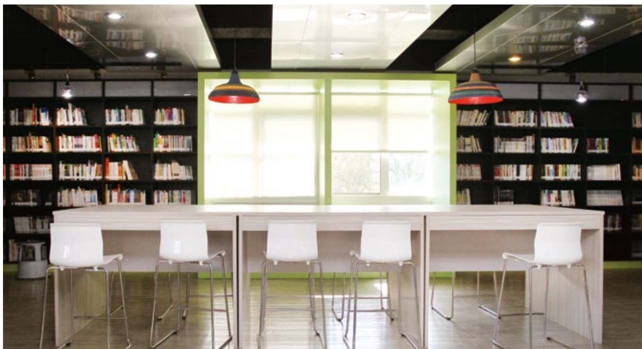
埔里鎮立圖書館從館藏挑選到空間設計，都讓青少年更願意在圖書館吸收新知。

對於採購電子資源、館藏數位化與網路資源的選擇原則，詹麗萍在其著作《電子資源與圖書館館藏發展》都有完整的論述。由於電子資源的採購為目前電子館藏發展的主要方式，但其計價模式與授權合約相當複雜，圖書館員在徵集電子資源時，必須具備辨識、選擇與取得不同資訊媒體的能力，對電子出版市場及代理商的動