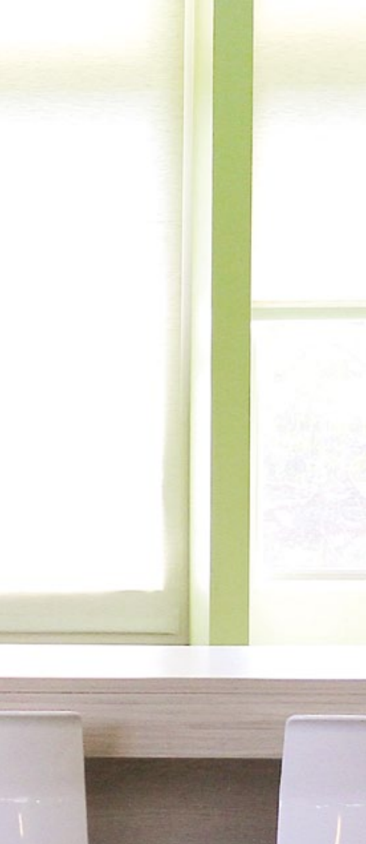
埔里鎮立圖書館從館藏挑選到空間設計，都讓青少年更願意在圖書館吸收新知。