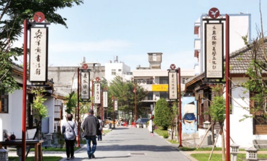
鹿港藝術村由日式宿舍群改造而成。