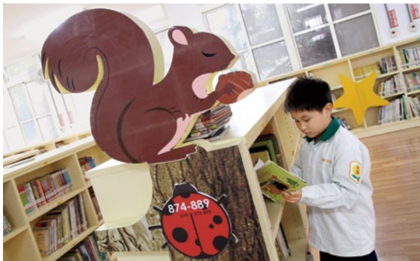
小朋友可以於鹿港鎮立圖書館兒童室享受閱讀樂趣。