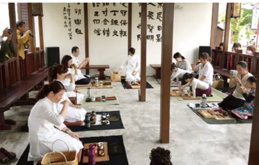
鹿港藝術村舉辦茶道活動。