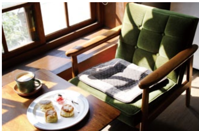
「Bhava。巴瓦咖啡食研室」以在地小農所生產的安心食材烹製而成餐點、飲品。