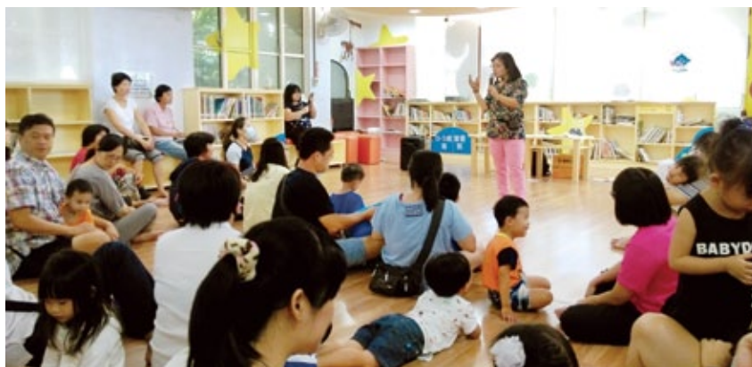
鹿港鎮立圖書館舉辦嬰幼兒閱讀起步走講座活動。

閱讀，是旅人親近一個地方的開始，在旅途中與作者筆下的城鎮相逢，讓旅行有了更深刻地體悟。