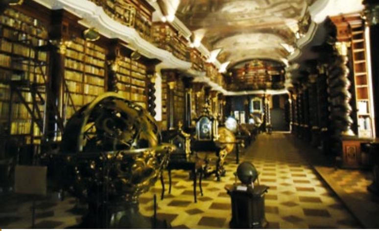
捷克國家圖書館的巴洛克大廳。

到了售票口才發現參觀必須要經導覽員帶領才可以進入而且還有時間及名額限制，建議可以10點先來買票再排隊（門票含導覽費用是220kc）。導覽人員用英文先介紹整個克萊門特學院建築與歷史，跟著導覽員參觀路線即看到此行最主要目的地圖書館的巴洛克大廳，相信所有參觀者看到眼前巴洛克時代華麗的裝飾壁畫和具有歷史價值的地球儀一定會被那華麗現場與特殊的氛圍怦然震攝住，彷彿看見了美女與野獸電影場景裡中古歐洲的宮廷圖書館，可惜的是這個美麗的大廳並不開放拍照，筆者只能在微弱的燈光下匆忙偷偷按快門。依據官方提供資料，巴洛克式的圖書館大廳自18世紀以來即一直保持不變，目前捷克國家圖書館共有691萬9,075件館藏，2萬1,204份中世紀手稿，約4,200本古版書，主要館藏為地理和天文地球科學，至今仍擁有捷克地區最早的氣象記錄 3 ，館內收藏的地球儀由Jan Klein設計同時也是布拉格廣場著名的天文鐘的主要設計者。