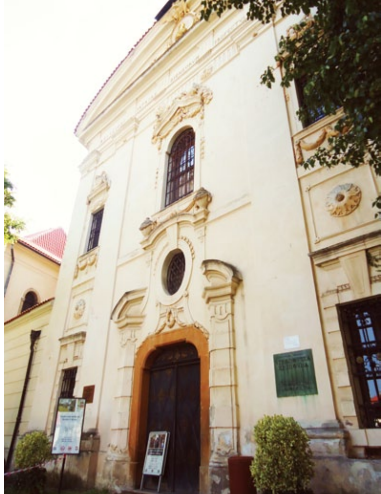
斯特拉霍夫修道院圖書館入口。

由於國家圖書館導覽員的極力推薦，加上惡魔聖經就是製作完成於13世紀捷克波希米亞地區的修道院，因此腳勤的筆者決定依照導覽員的推薦前往建於12世紀（1140年）位於布拉格斯特拉霍夫區最古老且最大的修道院——斯特拉霍夫修道院（Strahovský klášter） 5 。依據國家教育研究院圖書館學與資訊科學大辭典中資料 6 指出：捷克圖書館事業的歷史可追溯到西元9世紀，最早出現的是修道院及寺廟圖書館。斯特拉霍夫修道院仍保留著中世紀風貌，1983年整座修道院被列入世界遺產名錄，相較於老城區這裡觀光客非常少，修道院內的圖書館是在1670年開始興建，圖書館售票入口是羅馬式建築的外型，在這裡買票參觀時別忘了幫相機也買一張門票。這裡也一樣被稱「世界最美圖書館」，相較於克萊門特學院巴洛克大廳的美，那斯特拉霍夫修道院圖書館更是美到沒朋友，筆者在這個圖書館的現場，只有無敵澎湃的感動。