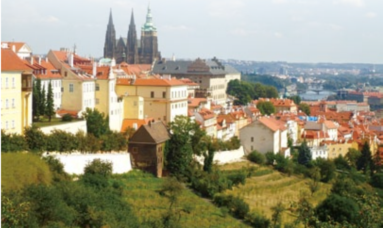
從修道院山區俯瞰布拉格區。

筆者在這裡買了一瓶從18世紀就頗負盛名的葡萄紅酒後，沿着修道院回程途中不經意發現了一可處俯瞰布拉格老城的絕佳景點。喝著葡萄美酒俯瞰城市美景，想著此行造訪的夢幻圖書館，無論是求可以求婚的華麗而浪漫的克萊門特學院圖書館，還是古老、恢弘令人沉醉的斯特拉霍夫修道院圖書館，都讓人不禁有一種「朝聞道，夕死可矣」此生足矣的滿足感。☉