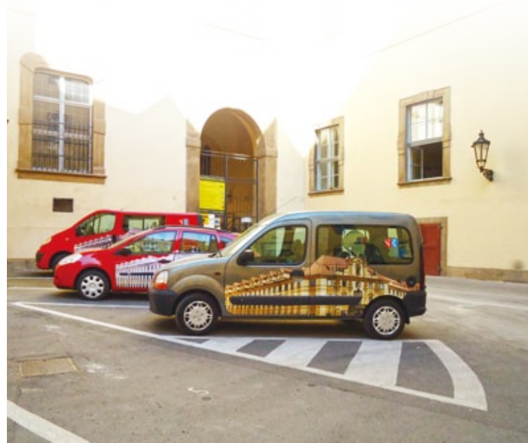
捷克共和國國家圖書館巡迴書車。

在參觀路線途中經過一本大書，筆者曾一度以為它是傳說中「巨大的惡魔聖經 The Devil's Bible」 4 ，詢問導覽員得知它是2005年被列為捷克共和國國家文化遺產的（Vyšehrad Codex 拉丁語）加冕福音書，被認為是波希米亞最重要和最具有價值的手稿。至於《惡魔聖經》則一直被保存在瑞典皇家圖書館，在2007年時曾借給捷克國家圖書館展出4個月。導覽員接著介紹捷克國家圖書館收藏的手稿與早期印刷書籍，除了存有捷克語文獻外，也保存著其他來自奧圖曼帝國、中亞、土耳其、伊朗和印度的古老資料，其中最古老的手稿可回溯至伊斯蘭紀元792年（Nizámí, No. 114）；最近的則來自20世紀初期，這些收藏反映出各種文學類型的美學多樣性，捷克國家圖書館在2005年獲得由聯合國教科文組織之世界記憶計劃所頒發的「直指獎」（Jikji Prize），以表揚該館在數位化古舊文件上的努力，或許是感受到筆者對於手稿、古老文件等館藏的興趣，導覽員建議筆者可以去另一個修道院圖書館參觀。