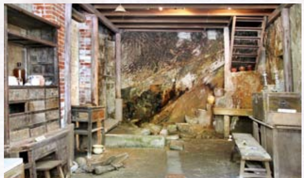
百年石頭屋原為一間中藥鋪。

走進不見天街，除了可逛逛店家、品嚐美食，還有一間百年石頭屋，約建造於1906年（民國前6年），原為中藥鋪，因而保留許多石器與古老的製藥器材。屋內還有為躲避美軍空襲於二次大戰期間所開鑿的防空洞，在當時並非一般人家所能擁有，透過這些珍貴的保存，讓參觀者可以懷想古厝過往的繁華光景。