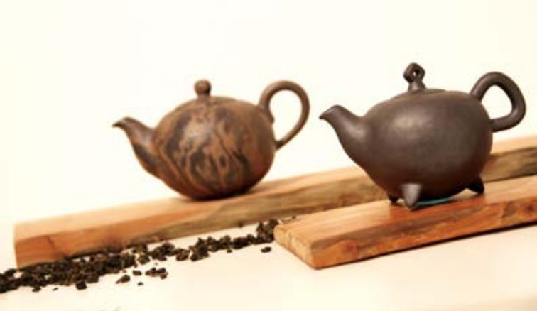
茶葉為石碇的主要產業，因而積累出豐厚的茶文化藝術。