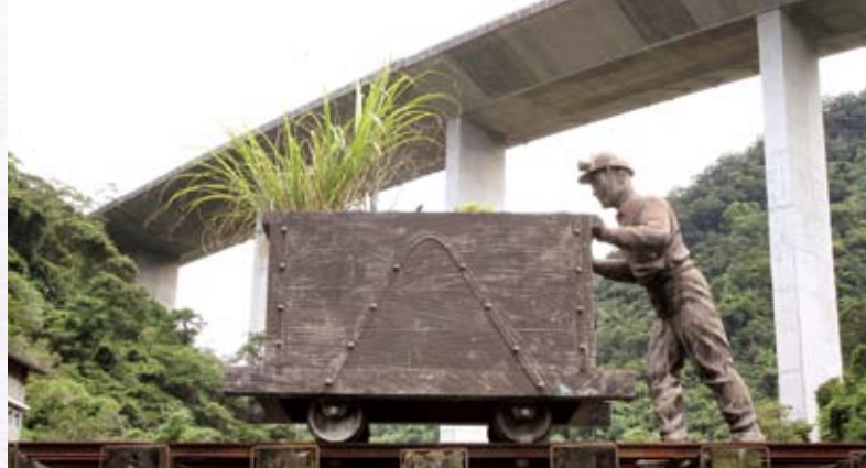
石碇保留日治時期的運煤橋遺跡。

漫步在烏塗溪親山步道，不但能了解石碇的歷史、文化、產業，亦可沿途觀察自然生態、欣賞奇景。烏塗溪觀景橋下，溪水清澈，魚兒優游其中，還有兩塊巨石，因形似大小山豬而得名，是相當特殊的天然地理景觀；接著往前行走，抬頭仰望，高達 65 公尺的烏塗溪高速國道 5 號橋墩，曾是臺灣最高的橋墩，目前排名第三。而橋墩旁的水泥牆上有石碇藝術家楊敏郎的作品「龍蟠巨石護河川」，並題有詩句「龍穿雲霄麟光閃閃／石碇山城聞蛟聲／門跨蒼穹流水潺潺／烏塗溪畔指鯉影」，為親山步道增添一份人文氣息。