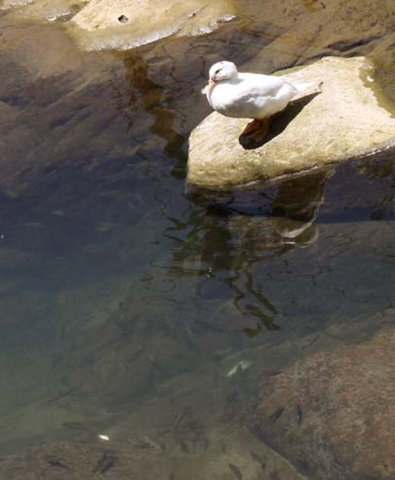
石碇地區擁有豐富的自然生態景觀。