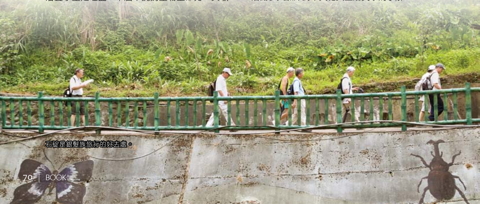
石碇是銀髮族旅行的好去處。

另外，新北市立圖書館石碇分館也結合茶文化特色館藏，舉辦閱讀地方產業「閱茶心」講座活動，像是9月7日的「茶與陶的對話——泡茶的生活樂趣」、10月12日的「茶藝之美——茶道精神之美學」、11月9日的「春天裡的一抹綠——日本抹茶道」、以及12月1日的「閱茶心之茶席成果（戶外課程）」，銀髮族皆可經由活動參與加深對茶文化與生活美學的了解。