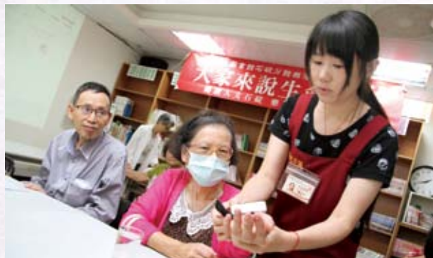
新北市立圖書館石碇分館備有簡易型血壓計，供銀髮長者測量血壓。

每個月第三週週四下午 2 點到 4 點，圖書館教室會舉辦樂齡讀書會「大家來說生命故事」走讀人文石碇、樂活與傳承活動。長輩們可以一邊品嚐茶香的甘醇，一邊聆聽石碇耆老鄉親分享屬於在地的生命故事。