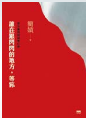
《誰在銀閃閃的地方，等你：老年書寫與凋零幻想》