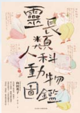
《靈長類人類動物圖鑑》

試想規劃一場短程旅行，一日來回的，內容物可以很輕便，簡單的手提行李就能夠說走就走。若是兩天一夜，登機箱可能就必須派上用場；三天兩夜或是五天四夜呢？行李箱大概就必須出動。倘若更久，為期一個月的旅行，為期一季的旅行，甚至是為期一年、10年、20年呢？人們不會輕忽長期的旅行，卻多半不懂如何為老後的生活做預習，甚至在那之前，缺乏許多可能的想像。正因為是循序漸進的，一日一日緩慢推移的，當你意識到，便已逐步抵達。