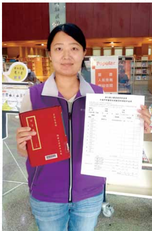
彰化縣立圖書館閉架書庫藏有《四庫全書》珍本。