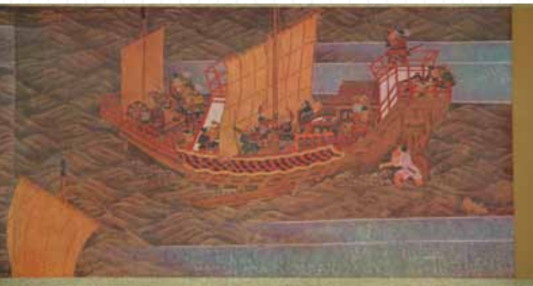
《國寶神功皇后御緣起》以譽田八幡宮所藏的紙本著色「神功皇后御緣起」繪卷複製而成。

《國寶神功皇后御緣起》繪卷為日本昭和 11 年（1936 年）4 月，由當時的大阪市「登龍閣史學部」，以譽田八幡宮所藏的紙本著色「神功皇后御緣起」繪卷複製而成。繪卷所謂的「御緣起」，是「由來」、「沿革」的尊稱。日本在近代以前，記載神社、佛寺或祭神、名人等等的由來、沿革或功績甚至神蹟、靈驗等，常會使用「御緣起」的字詞。「神功皇后御緣起」描述、記載著神功皇后的主要功績、神蹟，特別是「征服三韓」的事蹟。