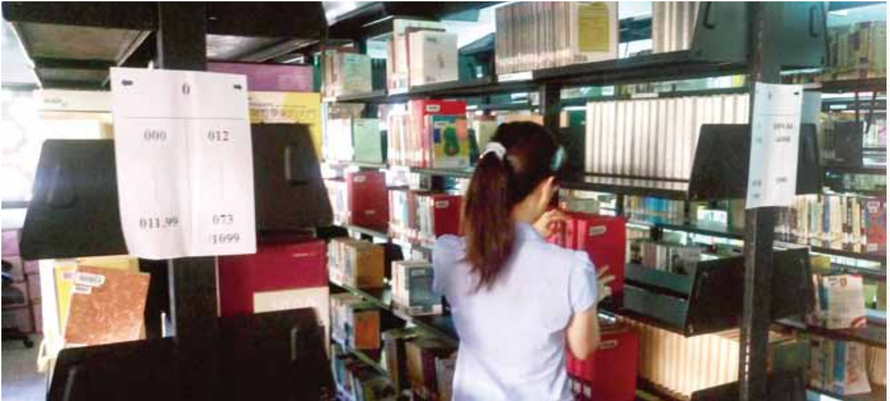
彰化縣立圖書館閉架書庫擁有 7 萬冊書報雜誌。

館特別提供閉架書庫調閱服務，由於閉架書庫是採閉架密集陳列，因此不對外開放，但只要是持有彰化縣公共圖書館借閱證的讀者均可申請調閱閉架書庫內的圖書，可外借資料的部分館前將所調閱資料歸還至一樓服務臺，取回借閱證。