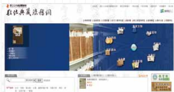
國立公共資訊圖書館「數位典藏服務網」網站自 2008 年建置以來，迄今將屆滿 10 年，數位技術皆有提升，今年爭取經費進行改版升級，預計於今年 12 月更換新的服務網。