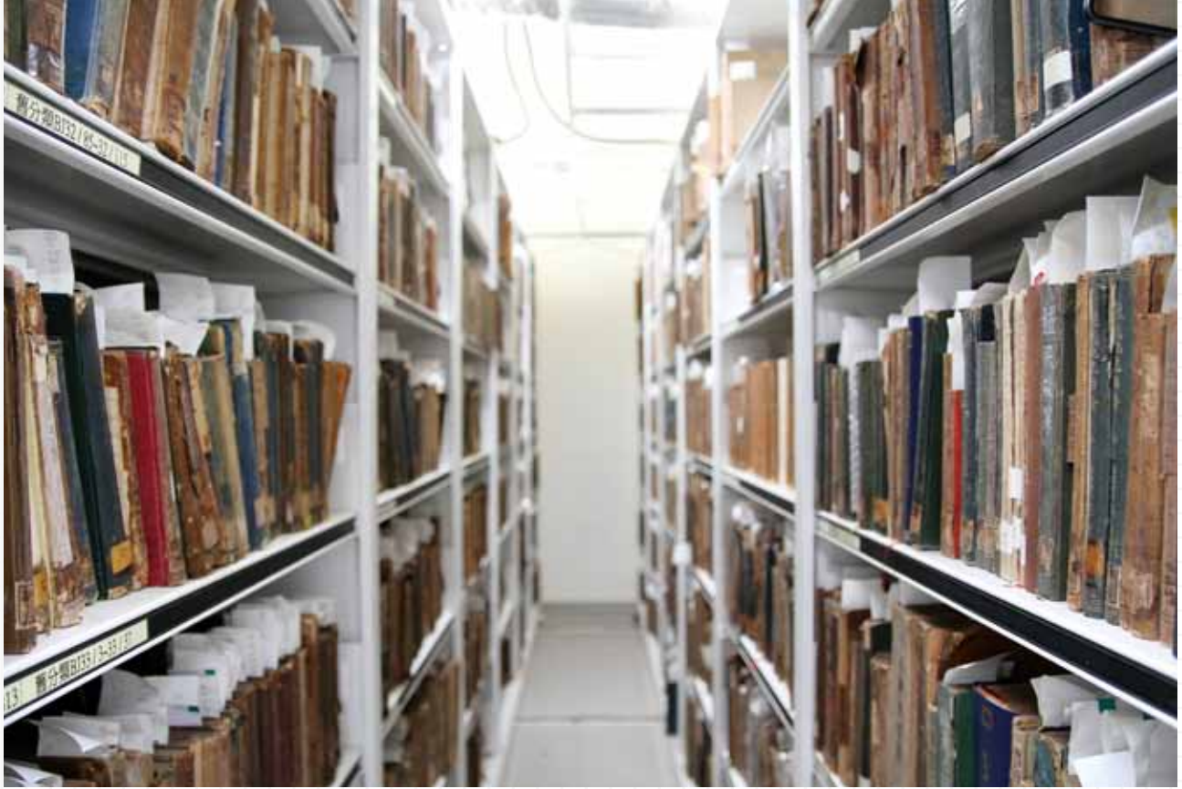
國立公共資訊圖書館「特定資料保存區」藏有約 2 萬 1,526 冊日文舊籍資料。

為了保存與維護這些珍貴文獻資料，國資圖採取門禁管制，一般讀者無法擅自進出，若有機會來到「特定資料保存區」進行研究或特定參訪，除了填寫申請單，請切記遵守環境的維護。先做手部消毒清潔，將口罩、手套戴上，踏進書庫前，雙腳於門口腳踏黏墊踩一踩，預防將灰塵、蟲卵等有害物質帶入「特定資料保存區」。