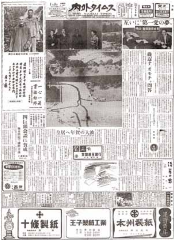
《内外タイムス》反共年代進口的奇特日文報，由日本東京發行的日文僑報。

為增加數位典藏被利用機會，讓民眾可以從不同平臺連結，國資圖也加入檔案管理局跨組織檔案資源整合查詢平臺（ACROSS）、及文化部規劃建置之「文化資源庫」（前身為「國家文化資料庫」）。