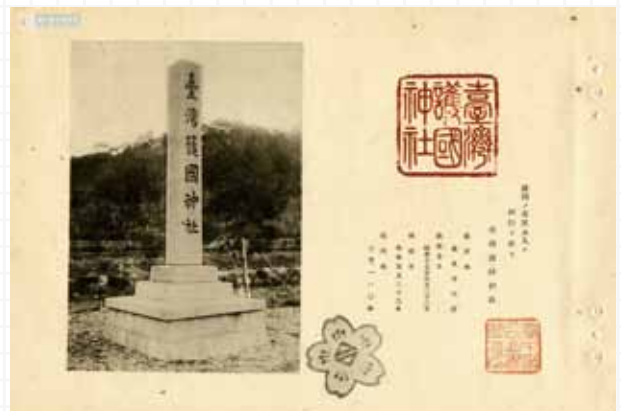
《鎮座紀念 臺灣護國神社》詳實記載臺灣護國神社成立的緣由與過程。