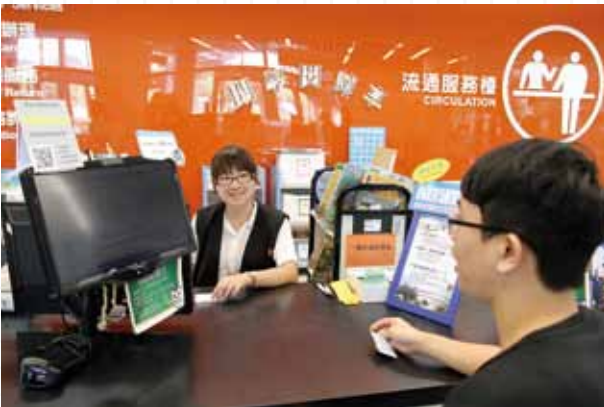
民眾可透過國立公共資訊圖書館流通服務臺調閱閉架式「一般書區」的書籍。

這一冊冊具有生命的寶貴書籍，正等著我們從圖書館的秘密基地——閉架式（密集、罕用）書庫，將它們取出閱讀，重現生命力量。