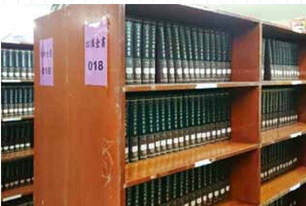
苗栗縣立圖書館「罕用書區」有典藏一套四庫全書。

一般來說，不是每間公共圖書館都設有罕用書區，她說明，苗栗縣立圖書館設有罕用書區的原因，和館內的人力、經費和空間配置有關；為提供讀者便利的借閱空間，館內一樓陳列近2年新書，3年以上的書籍則移往二樓開架閱覽區。由於每年都會採購新書，長久下來，開架閱覽區的書櫃已經不夠陳列。