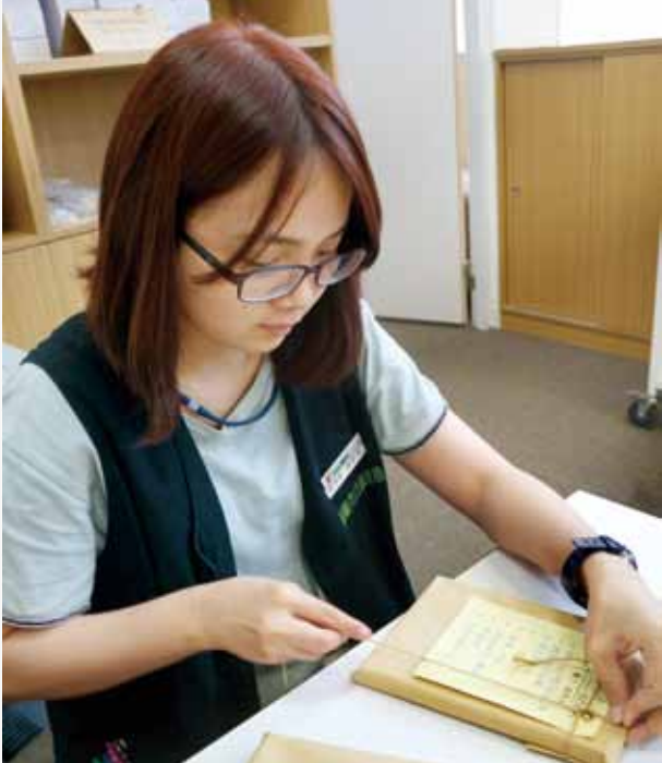
手作包裝加上手寫推薦卡，讓高雄市立圖書館總館「盲目約會」的神祕圖書多了情感的溫度。