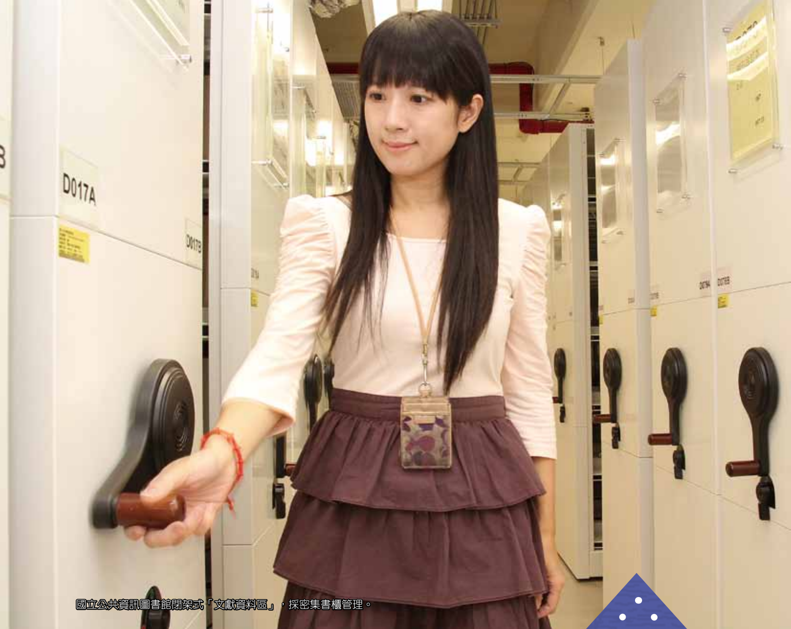
國立公共資訊圖書館閉架式「文獻資料區」，採密集書櫃管理。