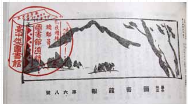
《臺中州立圖書館館報》創刊號，印有臺中州立圖書館印章。