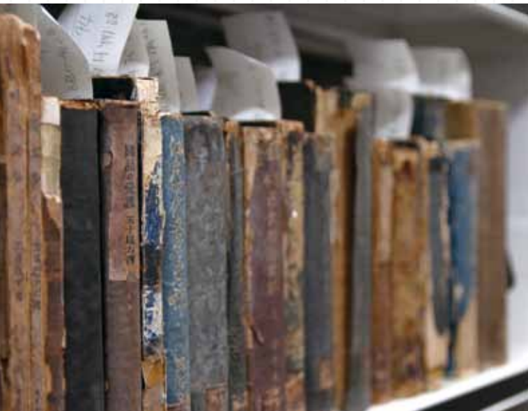
國立公共資訊圖書館「特定資料保存區」日文舊籍資料，極具研究價值。