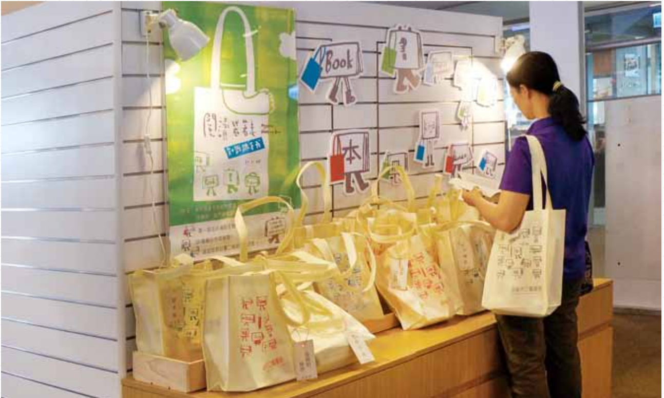
高雄市立圖書館總館推出「閱讀袋著走」活動，每天擺放出 50 份時髦設計的主題提袋，內裝 5 本生活主題書。