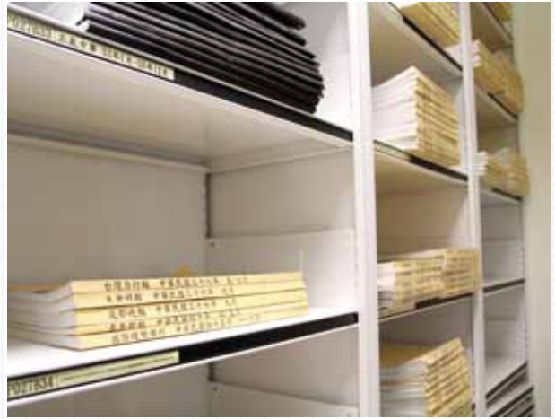
國立公共資訊圖書館典藏鮮少又珍貴的非主流舊報紙。