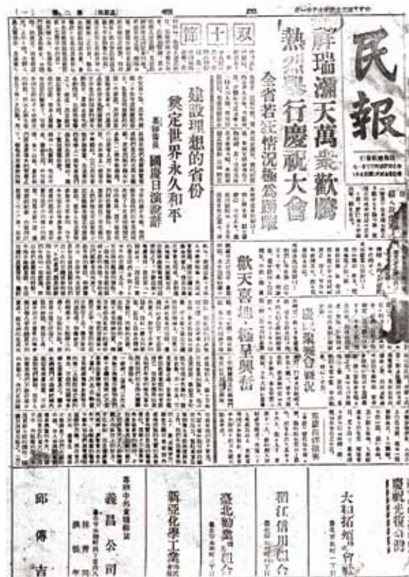
《民報》戰後由臺灣人創辦的第一份民營中文報紙。(國立公共資訊圖書館提供)

其中，日文舊籍因部分資料年代久遠，紙質自然脆化，目前多數均已絕版，這批舊籍十之八九為印刷品，少部分為手抄本、照片，內容稀有、珍貴但形式脆弱。自 2003 年陸續完成重要資料的數位化作業及管理系統，2008 年完成整合