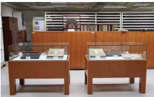
國立公共資訊圖書館「特定資料保存區」4 種珍稀館藏陳列於展示櫃中。

書庫內嚴禁煙火、飲食，全天候維持溫度 22.5^{\circ}\text{C} \pm 2^{\circ}\text{C} ，溼度 55\% \pm 5\% 的恆溫、恆溼環境，照明設備裝設無紫外線（NU）燈管，以減緩燈光中的紫外線對古籍紙張老化變質的破壞，也不能裝有任何水管設備，避免文獻資料被水沾溼，因而消防安全設施必須達維護標準之規定。