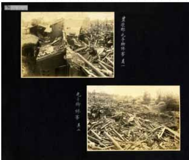
《臺灣中部大震災寫真帖》是於臺中州立圖書館時期所收藏的「孤本」。

《臺灣中部大震災寫真帖》是國資圖於臺中州立圖書館時期所收藏的「孤本」。誠如日文「寫真帖」所表示，指的就是兩本照片簿，其內容都是關於臺灣地震史上死傷人數最慘重的 1935 年新竹、臺中地震主要災區，也就是臺中州（含今日南投、彰化）與新竹州（含今日苗栗）的災情照片。較可惜的是，雖為第一手珍貴史料，出生卻不明，期待日後發現更直接的史料，以解開身世之謎。