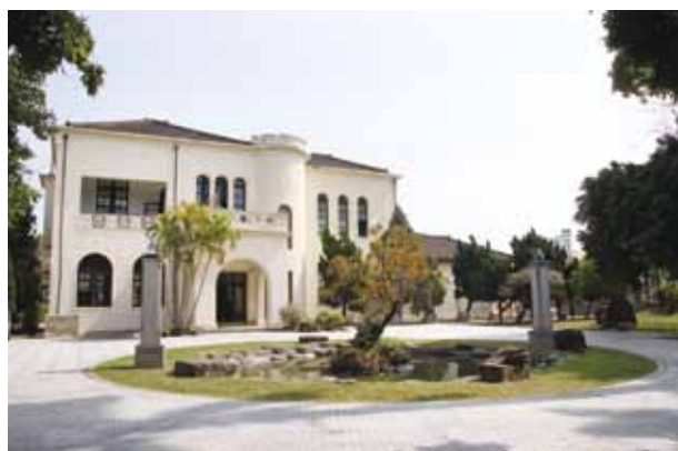
▲ 臺中放送局的主體建築屬於「過渡式樣」建築。

走進常設一館，它是昔日警察署長宿舍，因此規制最為宏大、做工最為精美。館內的展示主題包括「臺中文學大紀事」、「文學社群叢刊」、「臺中文學搖籃」、「文學關懷與批判」及「文學貢獻獎特區」等；而常設二館則設有「作家影音區」、「坐看文起時互動區」、「山海屯城區文學風景」、「發現臺中文學地圖」、「臺灣縣八景詩」等展區。展出形式活潑多元，除了靜態展出，還有互動體驗。旅人可將指尖輕觸螢幕，它將帶你進入作家筆下的場景，感受作家曾在臺中發生的點點滴滴，挖掘臺中文學地圖。