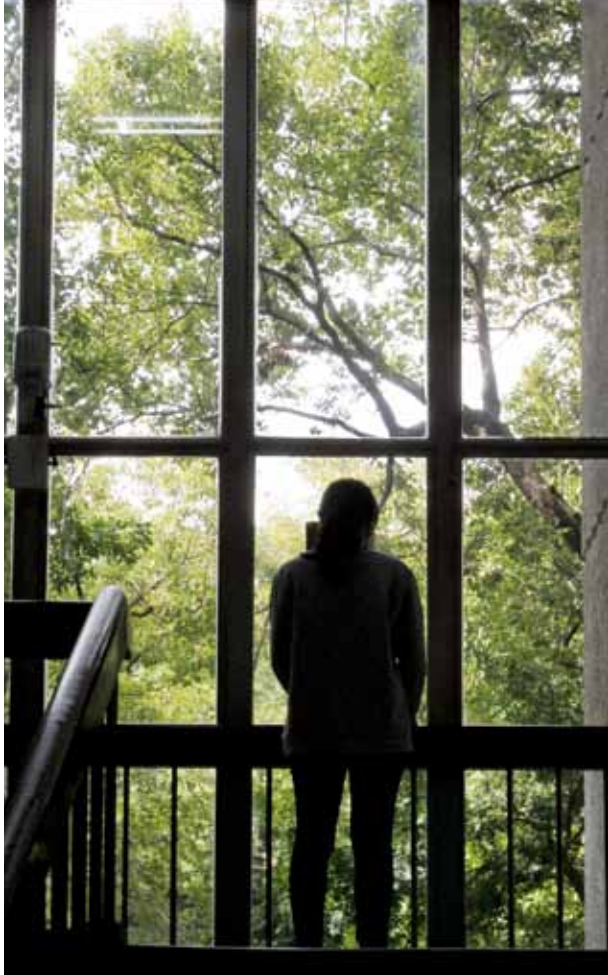
▲ 精武圖書館大量採用窗戶引入公園景觀。

「臺中公園往一中的出口會經過中興堂與臺中圖書館的後方，一是圖書資源寶庫，一是表演藝術的廳堂，兩座最具代表性的藝文空間毗鄰而立，我每次行經此地，總是無比的感動，心想，學校坐落在如此的文教區，真是幸福的極致。」