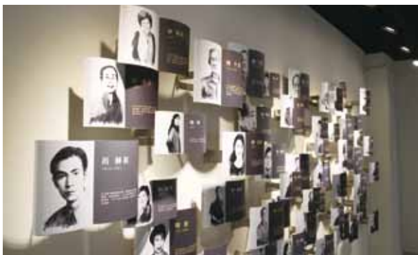
▲ 臺中作家典藏館「作家群像牆」形成不規則的排列組合。

而一樓展區正在展出的是臺中公園常民文化展「歲月流金——臺中公園時光漫步」，訴說著臺中公園自設立以來，陪伴一代又一代的臺中人，走過百餘年歲月。隨著歷史更迭，公園裡的建物興替、景觀變化、事件活動，都具體刻畫出從清朝以來的發展歷程。展覽透過照片、古地圖和新聞報導，讓參觀的旅人可以了解臺中公園的發展脈絡。在公園中的湖心亭（舊稱為池亭、中正亭），為雙併式頂涼亭、白色混凝土扶臂柱、木造梁柱及窗扇構成，融合了日式典雅與西式的穩健。從闢建以來，即為臺中市地標性建物，有許多圖徽都以湖心亭代表臺中，像是臺中市政府府