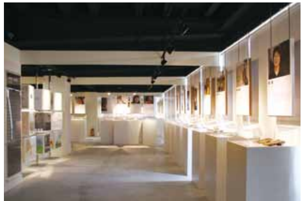
▲ 臺中作家典藏館透過常態展示，讓參觀者認識臺中作家。

徽，便是其中一個例子。另外，還有勝利碑、望月亭、廣播放送塔、臺中物產陳列館、縣社臺中神社殘蹟……，皆是臺中人共同的記憶。