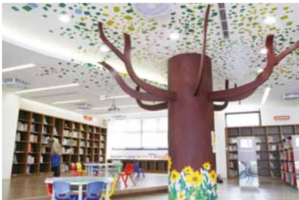
▲ 臺中市立圖書館北區分館兒童室。

臺中放送局的主體建築屬於「過渡式樣」建築，即無華麗裝飾的現代建築，只有在細部以西方歷史式樣元素裝飾。建築構造共有 94 扇窗戶組成，被譽為擁有最多扇窗戶的歷史建築物。旅人可隨著時間、天氣的變換，賞析窗戶映照出來的光影變化，將它書寫成一首詩作。