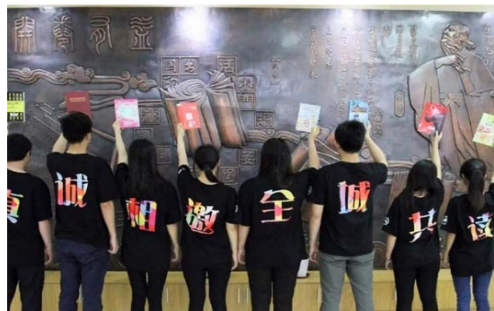
以書本為核心價值宣傳活動