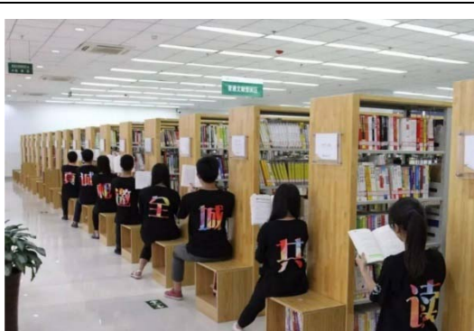
世界書香日圖書館活動宣傳

世界書香日活動由廈門市圖書館統一策劃，聯合 10 家聯盟圖書館、五家書店和 33 家民間讀書會機構，以「好書共選、好書共推、好書共享、好書共讀」活動，帶動全體市民的參與，活動主軸在 423 世界書香日當天下午，同一時間在不同圖書館、咖啡廳等 17 個不同的地點，由知名讀書會帶領人同時開啟讀書分享會。