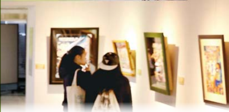
▲ 主題區塊式的動線布置帶領參觀者迅速融入展場氛圍。

「106 學年度全國學生美術比賽得獎作品巡迴展」在歷經臺北、新北、高雄以及臺東等地的巡迴後，訂於國立公共資訊圖書館（以下簡稱國資圖）總館作為展出終點站，希望透過各地多場的巡迴展覽，讓更多師生及民眾分享年輕學子的藝術創作以及感受他們對創作的熱情與堅持。