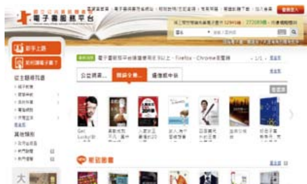
▲ 電子書服務平臺進行閱讀全壘打主題書展。

中信銀行表示，跨界火花，常常讓人感到驚艷，只要能繼續傳遞良善美好的價值，「我們願意嘗試各種可能。」