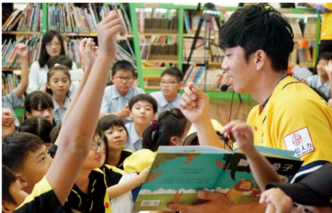
► 2017年「閱讀全壘打 夢想象前行」記者會，代言人周思齊化身周哥哥為學童導讀繪本。

示，今年除了延續借書送球票的獎勵外，也請國資圖協調行動故事屋進駐洲際棒球場，比賽開戰之前，爸媽可先帶孩子到故事屋聽志工媽媽說故事；另外，今年中信兄弟改造洲際球場，也在一、三壘側增設了8組家庭席以及親子氣墊遊樂區，這些都能讓大家的球場體驗更豐富，同時可以擴大推廣閱讀的觸角。