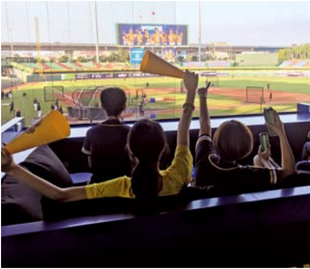
▲ 中信兄弟改造洲際棒球場，在一、三壘側增設了 8 組家庭席，豐富民眾看球體驗。

透過設立活動社群網站，結合運動明星的直播與微短片拍攝等方式，獲得廣大球迷關注。過去兩年分別有知名球星林威助、周思齊擔任代言人，成功吸引許多球迷走進圖書館閱讀。其中，球星周思齊更是過去「棒球閱讀教室」的推動者，他以棒球相關書籍作為誘因，讓學校裡喜歡打棒球的孩子、喜歡看棒球的學生，也能靜下心來翻翻書。中信銀行表示，去年的代言人周思齊本身非常熱愛閱讀，透過這個活動，希望球迷們向偶像看齊，一起愛上閱讀；今年王威晨也加入代言行列，雙球星代言就像讓閱讀成為一種呼朋引伴的運動，期許樹立一個喜歡閱讀、又愛運動的好榜樣。