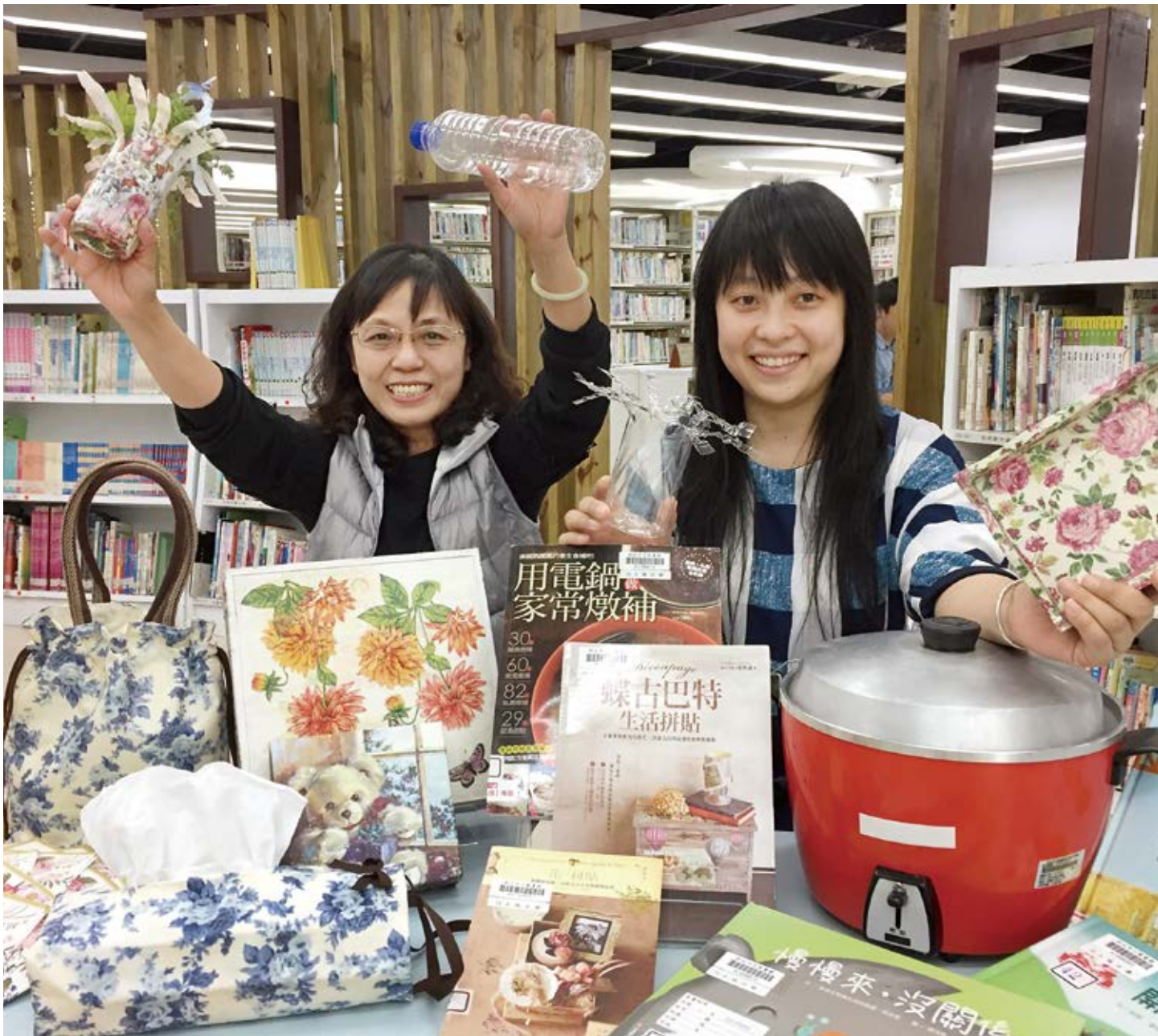
▲ 新北市立圖書館土城分館舉辦「繪本廚房—用故事妝點居家」活動。