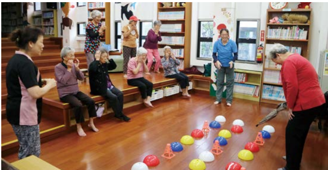
◀ 三星鄉立圖書館運動防失智課程。

中擺上喜氣洋洋的花盆，圖書館就會安排插花課程；有人皮膚容易過敏，也安排了手工皂課程，這些都與使用者的生活息息相關。