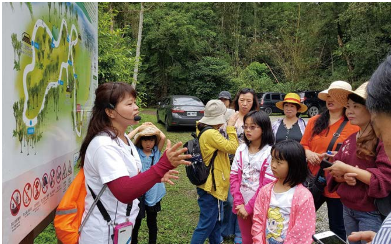
◀ 「三星 i 旅行」導覽課程。

三星鄉立圖書館在課程安排上，會根據需求規劃課程內容，並且貼心的將活動宣傳單寄送給鄉內每一戶人家。好比過年快到了，居民想在家