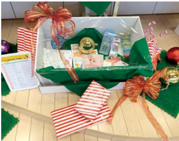
▲ 國立公共資訊圖書館展出各出版社推薦「新手爸媽給孩子的12項見面禮」。