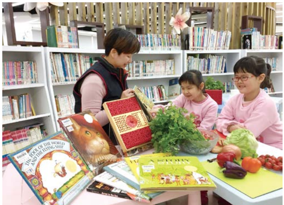
► 新北市立圖書館土城分館舉辦把故事變年菜活動。

結合食譜跟繪本，融合媽媽與孩子的日常需求，轉變成「繪本廚房」系列活動，像是把故事變年菜、用故事妝點居家、把客家糯米變桐花，都是透過繪本讓孩子先聽故事，之後延伸出料理或手作教學，藉機帶孩子到市場體驗挑菜買菜，再透過簡單的食譜料理教學，讓媽媽現學現賣，素人變身大廚，親子一起同樂，在活動中累積閱讀回憶。