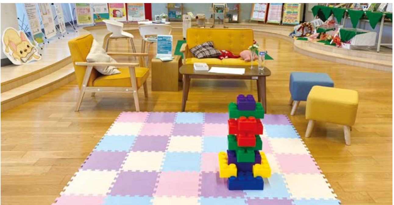
▲ 國立公共資訊圖書館「育兒 BOOK 夢——公共圖書館巡迴展」。

當然，數位科技仍不斷精進，圖書館勢必會引入更新、更便利的服務。身為國內科技應用圖書館服務領航者的國資圖，未來將應用前瞻資訊科技於館內，以創新、應用於建構智慧圖書館服務，例如近年來陸續開發行動借書、AI 機器