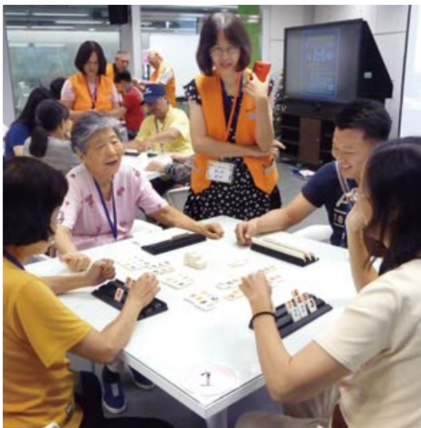
▲ 國立公共資訊圖書館祖父母節混齡桌遊播臺賽樂齡長者玩得不亦樂乎。