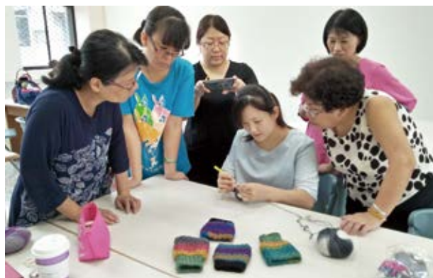
▲ 三星鄉立圖書館毛線編織課程。

而三星鄉立圖書館所扮演的角色就是推廣與宣傳，透過實際導覽與志工培訓，並進入社區、搭配大型活動進行宣傳，讓「三星i旅行」App被更多人運用，讓更多人在取得旅遊資訊的同時，也能深入了解三星這塊土地的故事。