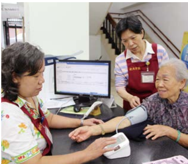
▲ 新北市立圖書館金山分館推出「金健康一代掛號、量血壓、腰圍、體重」服務。

公共圖書館以人為中心，讓服務融入民眾的日常生活，成為民眾在家庭與工作之外的幸福「第三生活空間」。