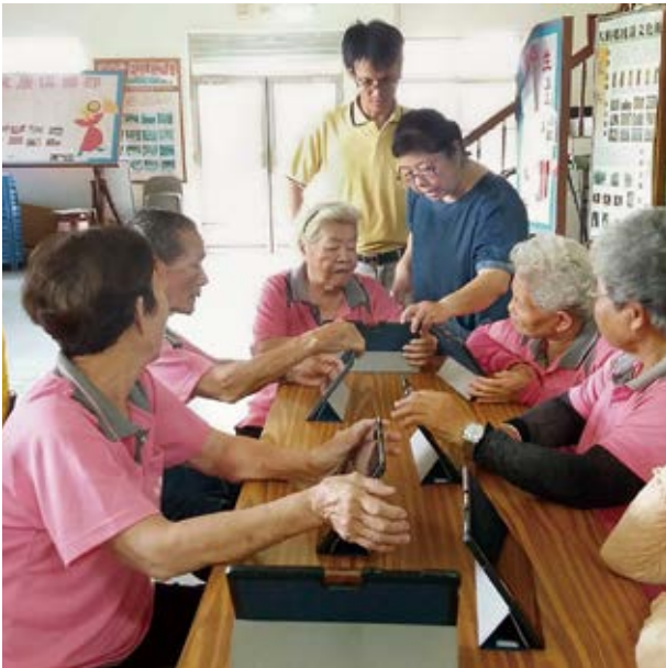
▲ 高雄市立圖書館大樹二館工作人員深入社區關懷據點，耐心教阿公阿嬤使用平板電腦。

因為圖書館，生活樣貌變得不一樣了！公共圖書館豐沛的教育資源，讓居民從中獲得培力、學習的機會，使家庭與社會關係無限提升。