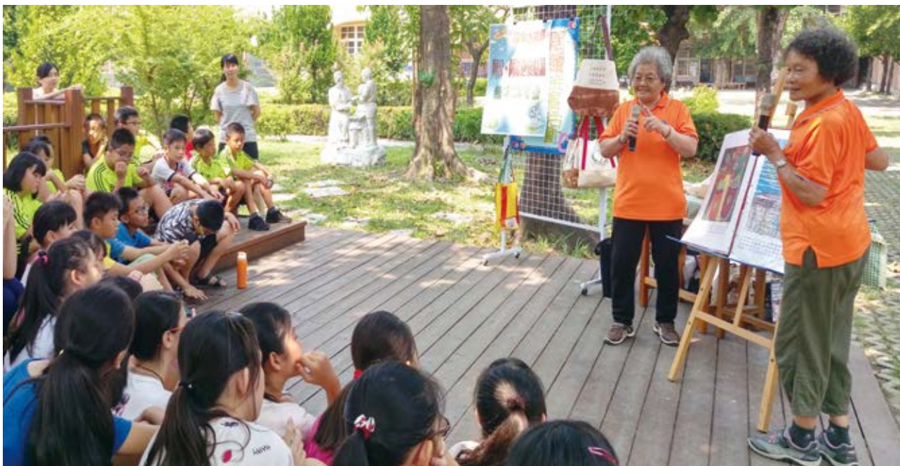
▲ 阿公阿嬤畫出了動人的作品，還親自到社區中為小朋友講述自己的生命故事。

當樂齡族開始進入圖書館，故事媽媽特別挑選能引起情感共鳴的繪本，並且以臺語說演；含辛茹苦撫育小孩困苦生活的《因為我愛你》、貼切補魚經驗的《旗魚王》、反映蔗農辛酸的《甘蔗的滋味》……，聽完故事，阿公阿嬤們反應踴躍，熱烈交流自己年輕時打拚的過往。