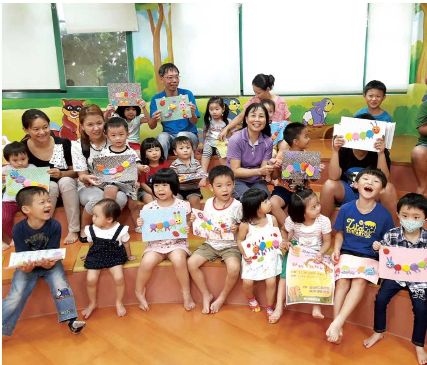
▲ 臺中市立圖書館龍井分館推動親子共讀「藝」起來，延伸動手做繪本。