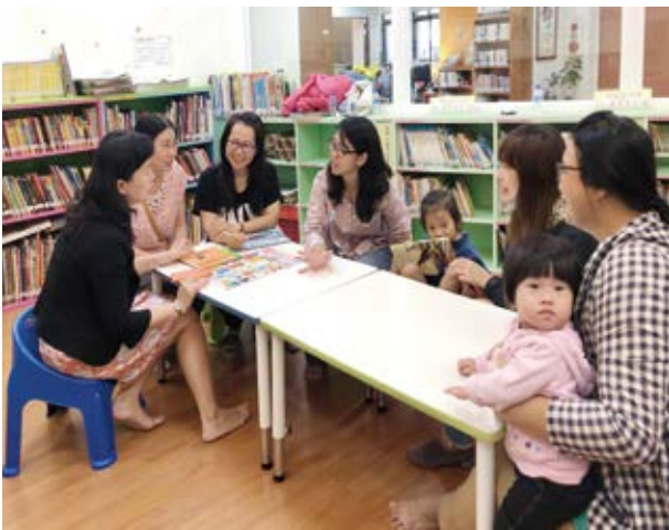
▲ 高雄市立圖書館林園分館是個大家庭，新手媽媽們在這裡交換育兒經驗。

現今的公共圖書館，從過往學生借閱書本、K書的地方，搖身一變成了全方位年齡層的教育學習大平臺！不僅可以讓孩子領略閱讀之美，出社會或已退休的成年人，也可透過圖書館得到培力機會。