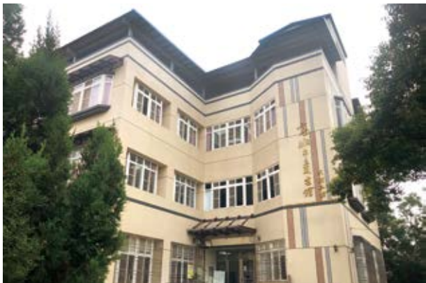
▲ 高雄市立圖書館大樹二館在社區中扮演著重要的教育場域。

在推動閱讀上，高雄市立圖書館大樹二館對輔助正規教育學習的經營也非常深耕，包含與社區各國小合作辦理本土語言課程，以活潑的方式用臺語介紹在地人文風情；教唱臺語歌謠，讓本土語言學習更加生活化；舉辦說故事猜成語及「臺灣俗語講看嘜」，提升本土語言的聆聽、閱讀及表達力；辦理「雲端作家面對面」，邀請作家到校演講，近距離分享寫作經驗，啟發學童創作靈感；邀請外語科系學生教小朋友如何透過網路自學英文；辦理多元文化講座，向小朋友介紹新住民母國文化；舉辦兒童寒假營隊、追風少年夏令營等活動，內容包含課業輔導、團康活動、資安課程、科學遊戲製作、水資源探訪、童玩製作等多元課程活動及體驗；辦理小蜻蜓兒童讀書會，以小團體方式進行閱讀，讓小朋友參與討論，提升閱讀興趣及社交能力……。