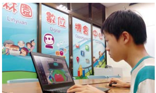
▲ 幼童時期上讀經班，到了高中銜接數位機會中心課程，孩子在高雄市立圖書館林園分館陪伴下一路學習成長。

社區民眾津津樂道的課程非常多元，其中讀經班、日語班、銀髮族彩繪班、數位系列課程是最讓民眾感覺受益良多的進修活動。