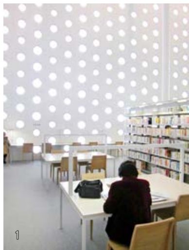
1 海之未來圖書館的設計，能夠得到特殊的採光效果。