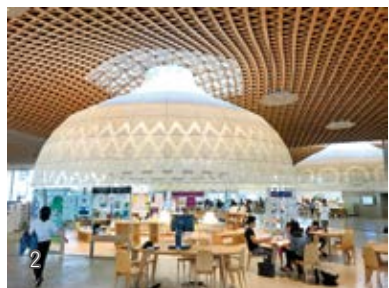
2 伊東豐雄的名作「岐阜市立中央圖書館」。