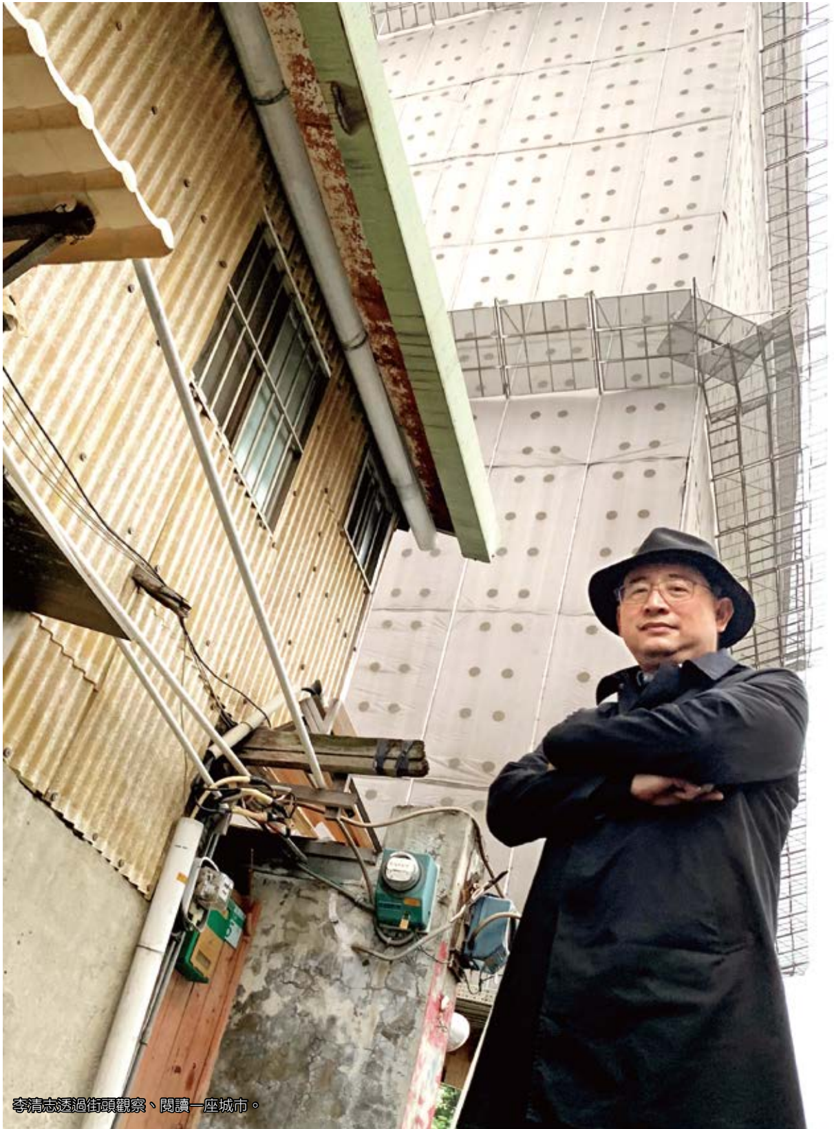
李清志透過街頭觀察、閱讀一座城市。