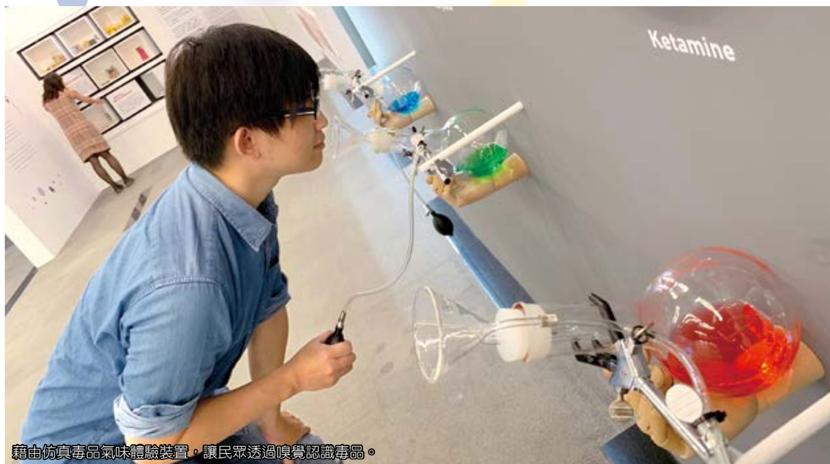
藉由仿真毒品氣味體驗裝置，讓民眾透過嗅覺認識毒品。

「識毒——揭開毒品上癮的真相」反毒教育特展，藉由場景模擬、科技互動裝置等體驗方式，強化觀展者的反毒價值觀，並建立更健康的支持系統。