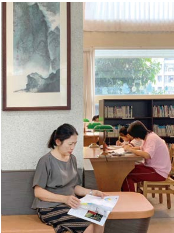
東山高中學校社區共讀站提供當期雜誌與書報，方便社區居民閱讀。