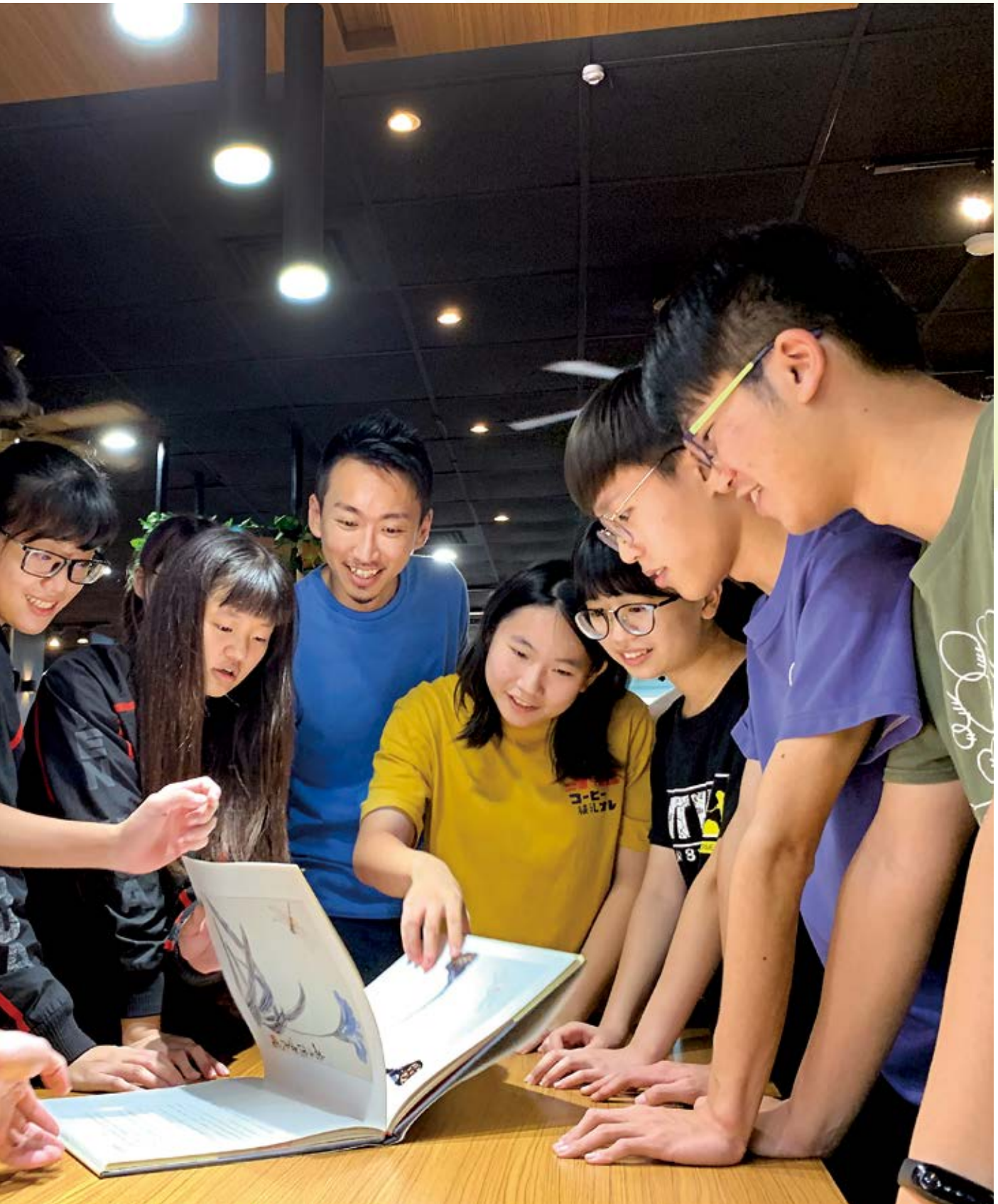
文華高中透過學校社區共讀站，開啟大家共同學習、討論的機會。