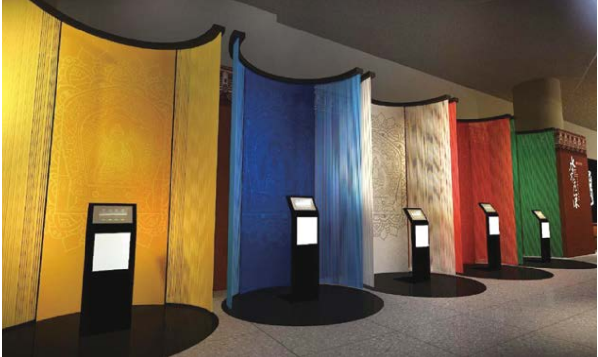
善本藝遊展區的平板互動區，透過 AR 擴增實境科技，讓民眾經由親身體驗，認識〈龍藏經〉中數個尊像。

並邀請國立暨南國際大學歷史學系教授講述日月潭從清朝到現今的發展過程，讓參與民眾有更深一層的了解。