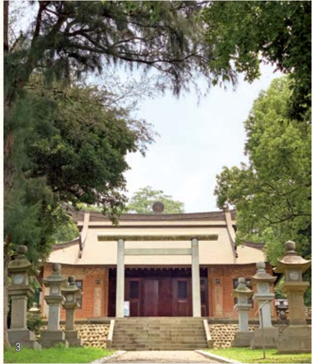
1 通霄鎮立圖書館波浪造型書櫃。