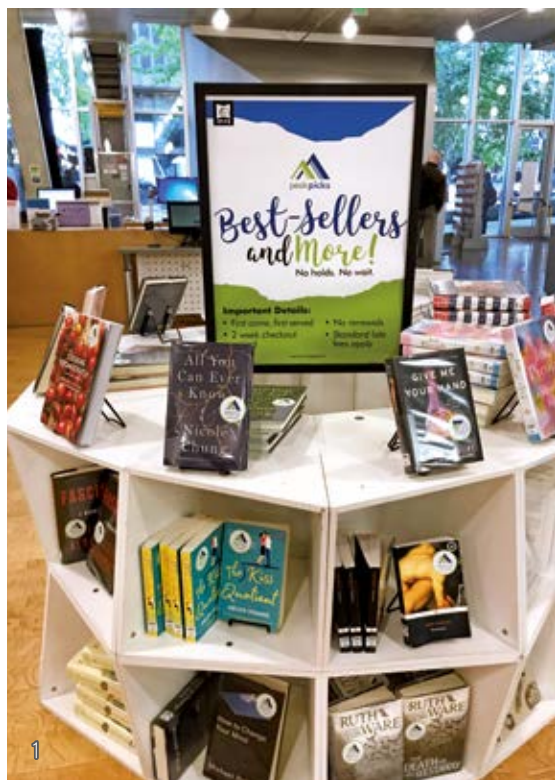
1 西雅圖公共圖書館在最醒目的場域展示暢銷書。

另外，美國公共圖書館有「圖書館之友」（Friends of library），該組織皆由義工所組成，是一個基層會員組織。「西雅圖圖書館之友」專為西雅圖公共圖書館提供運作支