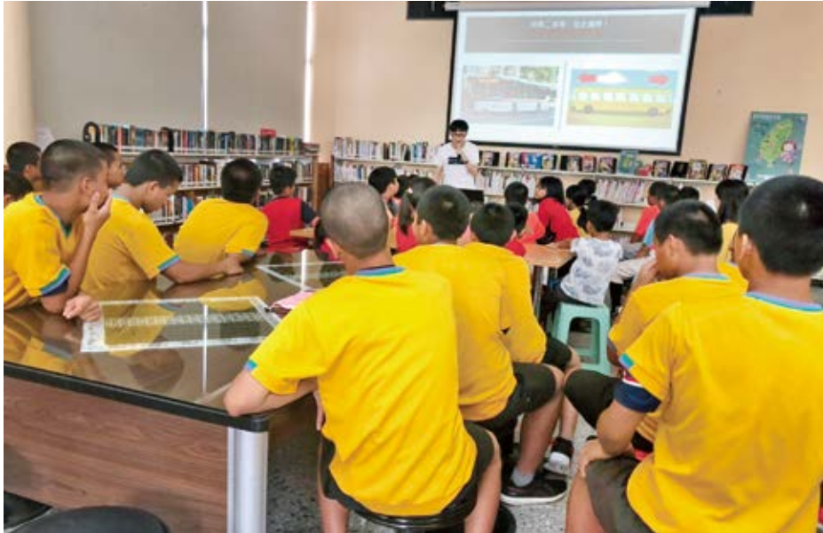
2019年「世界閱讀日」，臺東縣政府文化處圖書館推出「走讀探索福爾摩斯——『Book』『Book』為營」活動，帶領孩子一起探索科學真相。