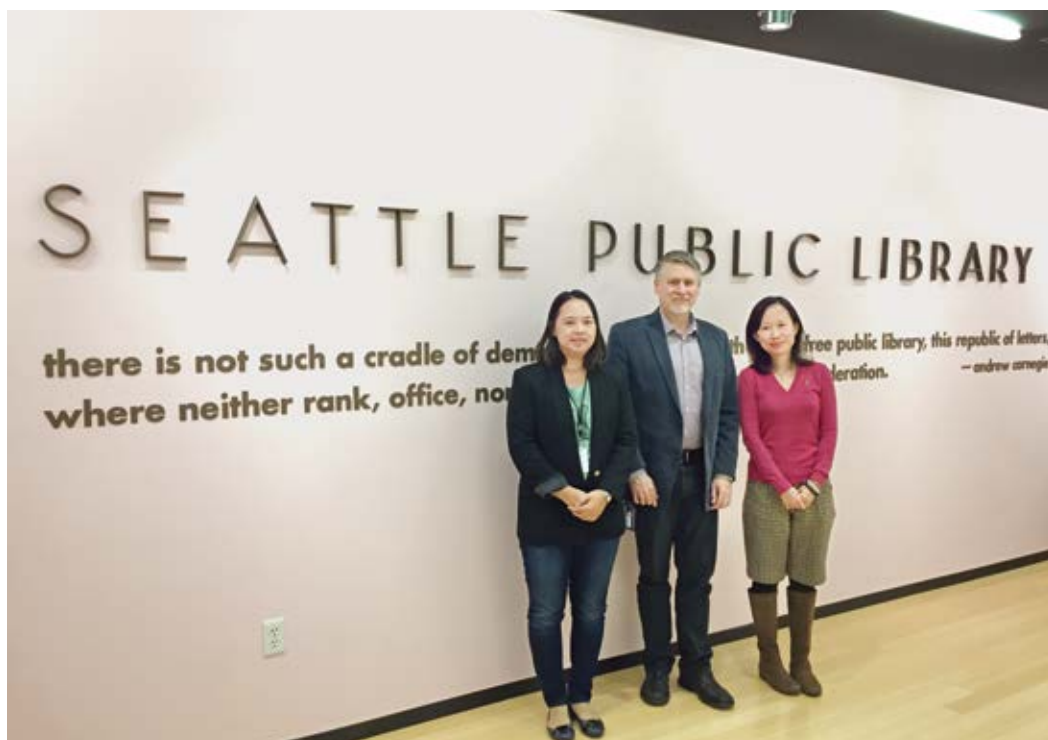
高雄市立圖書館派遣兩位館員到西雅圖公共圖書館進行為期 10 天的駐館觀摩。