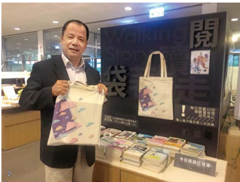
2 高雄市立圖書館「閱讀袋著走」活動設計，靈感來自於西雅圖公共圖書館的幼童禮袋。