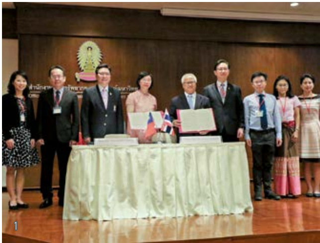
1 2018 年國家圖書館與泰國朱拉隆功大學合作建置泰國第一個「臺灣漢學資源中心」。