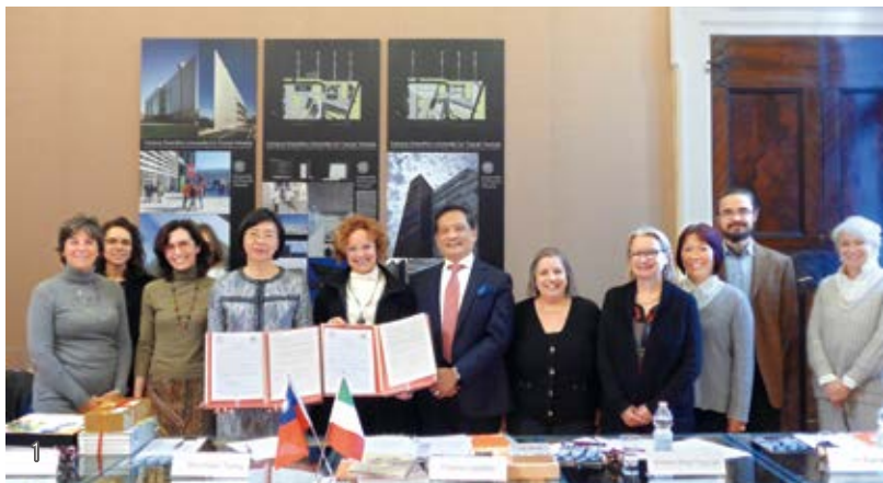
1 2018年國家圖書館與義大利威尼斯大學合作建置南歐第一個「臺灣漢學資源中心」。