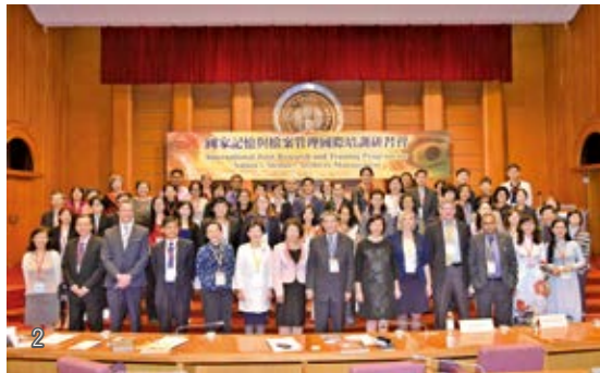
2 「2017 年國際圖書館專業館員研習班」來賓、講師與學員合影。