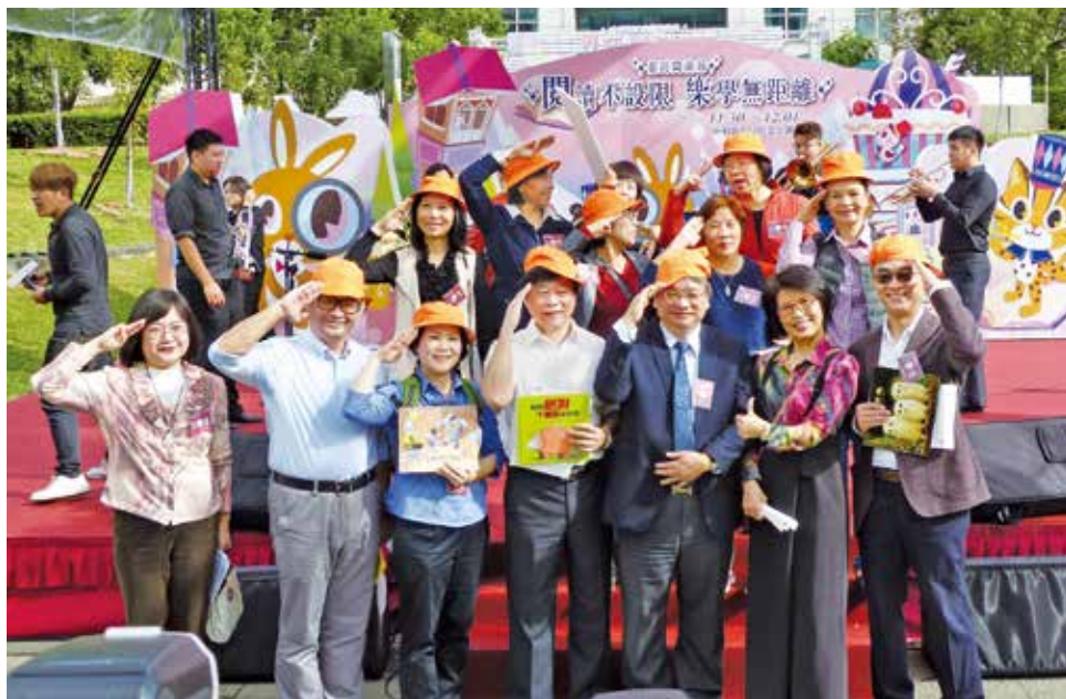
「閱讀不設限·樂學無距離」活動，以行動劇揭開臺灣閱讀節序幕。

國臺圖作為教育部指定的全國身心障礙專責圖書館，同時具有國內首屈一指的「視障資料中心」，配合12月3日的「國際身心障礙者日」，在2019年臺灣閱讀節推出主題性閱