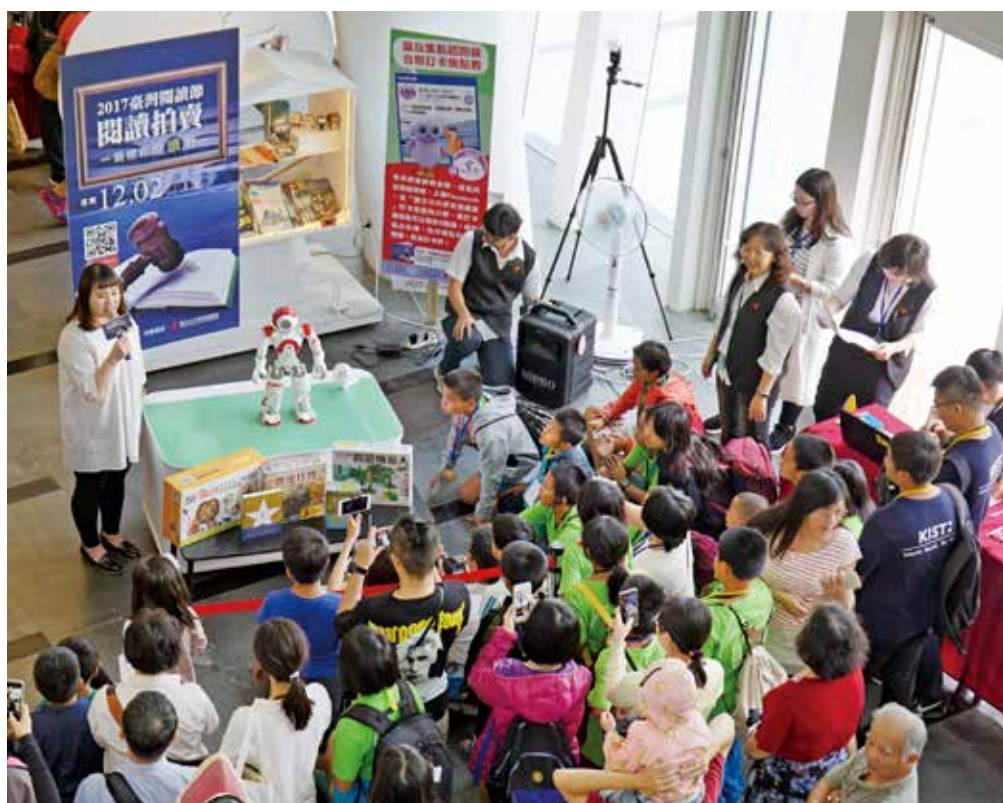
「閱讀拍賣·競標你的讀特」透過閱讀知識點數集點活動，讓讀者競標自己想要的閱讀拍賣品。

2018年的「不閱不睡·讀享生活每一刻」，融合夜宿與露營，藉由家庭親子共同參與夜宿圖書館的體驗，在書香中入眠，充分體會書本及閱讀之於生活的必要性，讀享生活每一刻。還有一場戶外圍爐夜讀，邀請