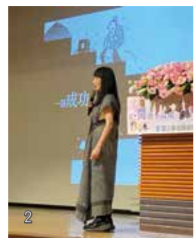
1 「閱讀不設限·樂學無距離」活動，身障朋友帶來精彩的音樂演奏。