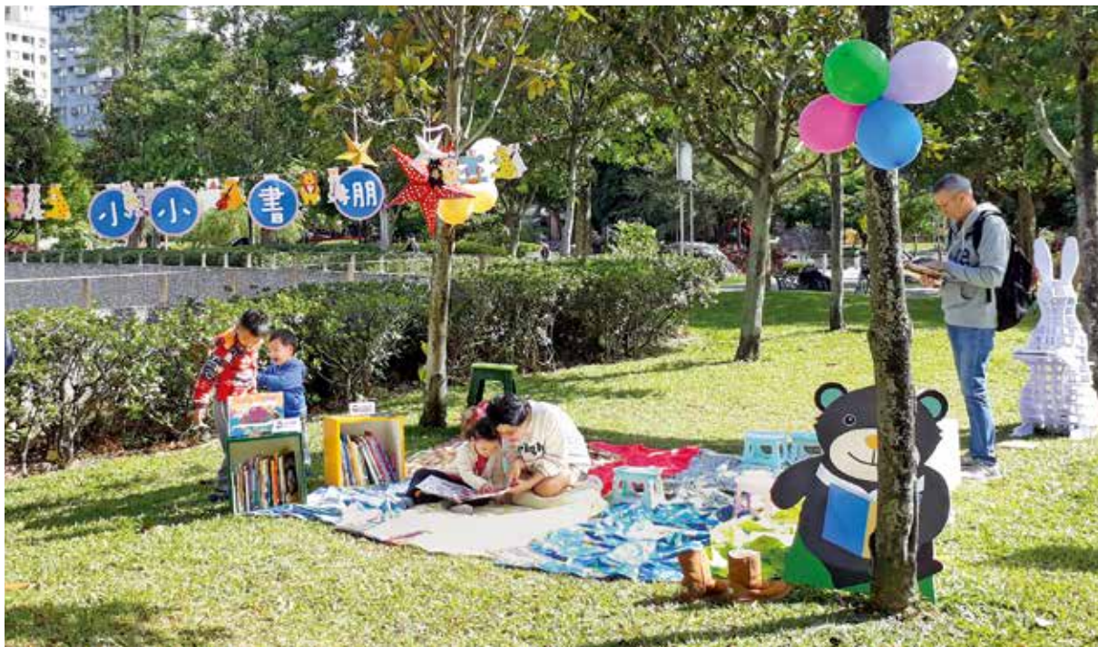
國立臺灣圖書館舉辦臺灣閱讀節活動，以館舍為中心，擴散到周邊的 823 紀念公園，打造閱讀公園計畫。

障者電影聽賞」活動、邀請身心障礙卓越人才開講的「真人圖書講座」或是「身心障礙體驗闖關」等活動，希望提供身心障礙朋友更多元豐富的藝文參與機會，也期望透過不同族群共同參與、溝通理解，建立和諧共融社會，「閱讀節剛好可以融入我們之前做的理念，透過嘉年華市集方式，讓更多人去體驗到身心障礙的閱讀現況。」