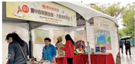
1 臺灣閱讀節的科普系列活動一直都很受孩童歡迎。 2 國家圖書館與博物館合作，推出「博物館嬉遊島」閱讀推廣活動。