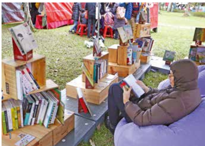
1 國家圖書館與 5 個駐臺辦事處合作，以世界文化為主題，推出「用閱讀環遊世界」活動。