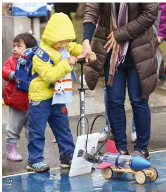
2 國家圖書館舉辦「森林·泡泡·科普樂」活動，透過跨域合作，推出「衝刺吧火箭車」科學教學、體驗活動。

立科學工藝博物館科普圖書館、國立海洋生物博物館、新竹縣政府文化局縣史館、客家委員會客家文化發展中心，規畫了「博物館嬉遊島」，包含科普益智、海洋教育、地方文化特色創意活動。