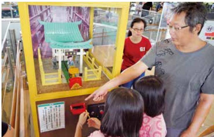
1 在臺灣閱讀節系列活動中，最讓讀者感覺新鮮躍躍欲試的莫過於「求籤機」。