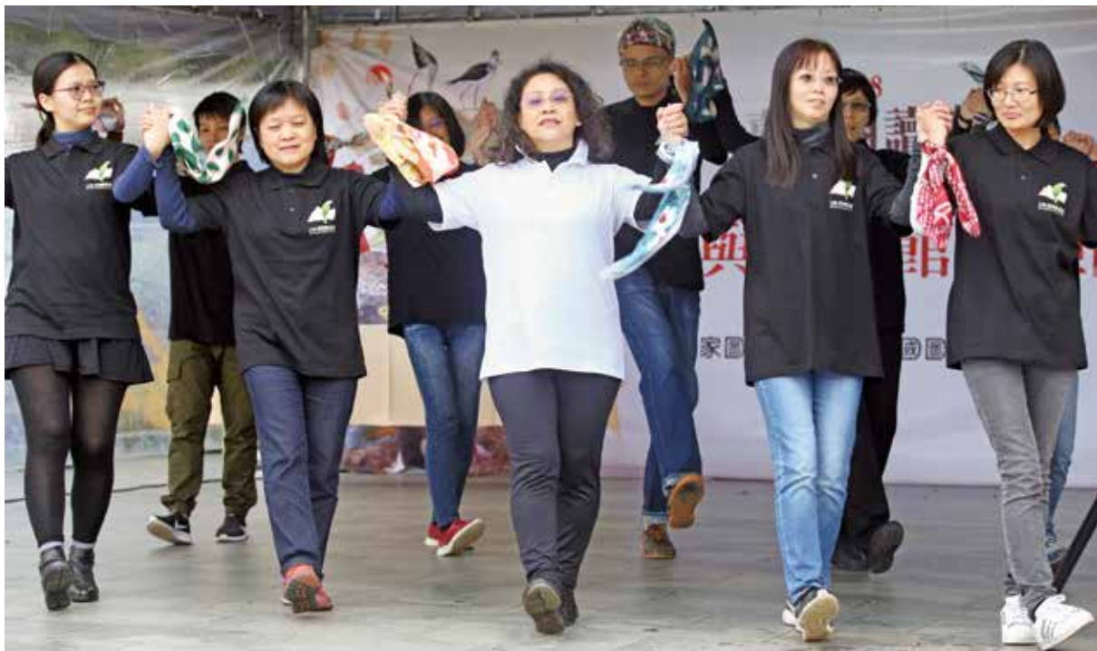
國家圖書館館員參與中華民國圖書館學會推出的「與圖書館的近身接觸」活動，在小舞臺載歌載舞。

室、家中都可以上網獲得，所以圖書館成了「相遇的地方」，然而圖書館有著學習、閱讀的功能，所以也藉由活動讓大學圖書館能夠有觀摩的機會，因此 2018 年邀請各縣市圖書館擺攤，2019 年則邀請中華民國圖書館學會一同參與。