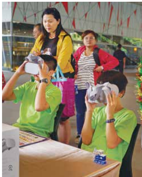
2 孩子將現場繪製的 2D 影像轉為 3D 的 VR 觀看，體驗 VR 科技的樂趣。