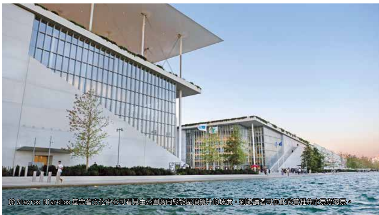
於 Stavros Niarchos 基金會文化中心可看見由公園處向綠能屋頂緩升的坡度，到館讀者可在此欣賞雅典市景與海景。

SNFCC 是由知名建築團隊 RPBW（Renzo Piano Building Workshop）所設計，建築師 Renzo Piano 因受到當地地名 Kallithea（意即美麗的景色）的啟發，規劃了由公園到建物逐漸抬升的人造緩坡，將大海的景致納入，重新串聯起原先斷裂的城市景觀與自然地景。建築物主體搭配大片玻璃帷幕引入自然光源與窗外美麗景致，讀者在此可以 360 度全景欣賞壯闊的雅典與海景；一旁引入海水的人工運河連結了建築與海洋，除了每週在運河舉辦的帆船小艇課程之外，冬日時光還可在結冰的運河上溜冰。巨型綠能屋頂如同魔毯（Magic Carpet）