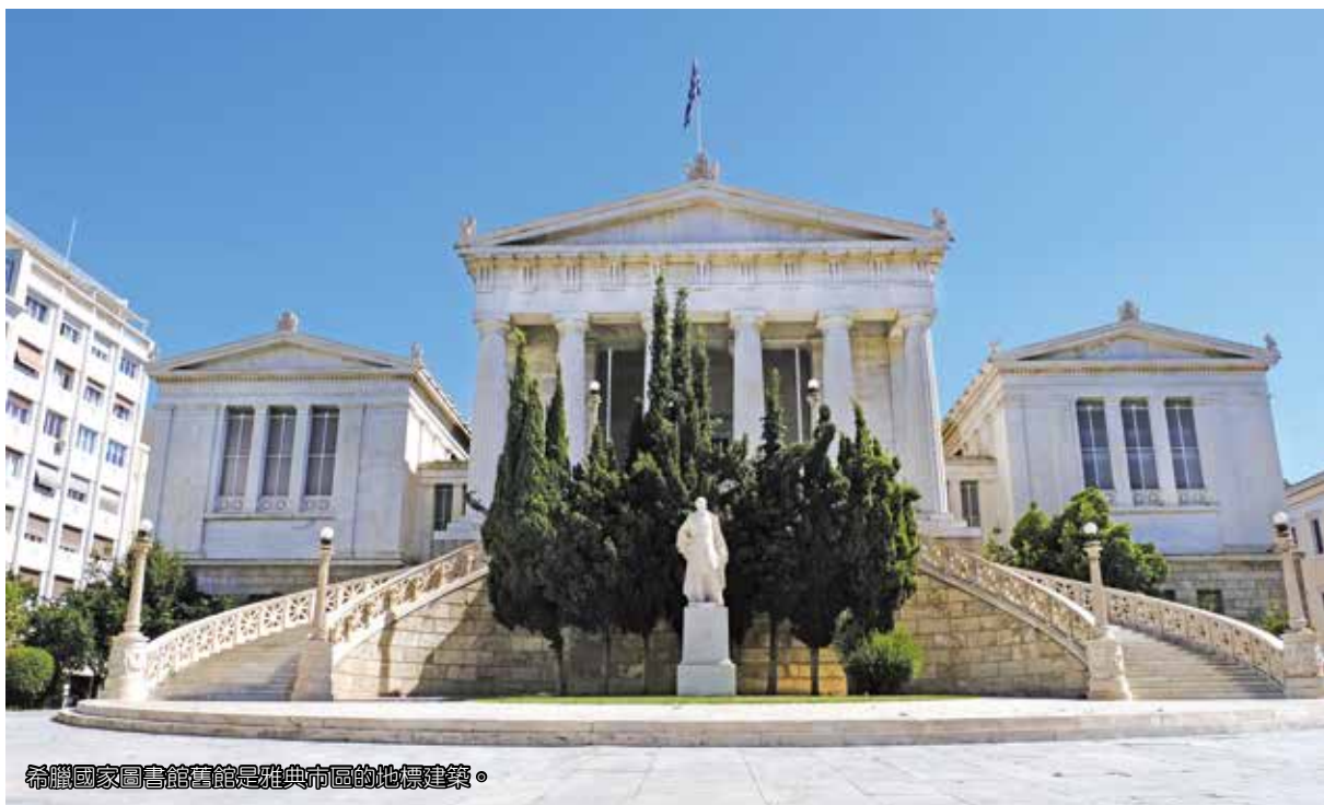
希臘國家圖書館舊館是雅典市區的地標建築。

希臘國圖成立歷史可追溯至 1829 年，起初館舍建於愛吉娜 (Aigina) 島上，其建物前身為孤兒院，成立之初館藏只有 1,800 餘冊圖書。至 1834 年該館遷移至雅典，並成為希臘第一所公共圖書館。1842 年與擁有 1 萬 5,000 冊精美圖書的雅典大學圖書館 (The University Library) 合併，使得館藏內容益加充實。1903 年希臘國圖再度遷移至雅典市中心，該館為凡倫羅斯兄弟 (Vallianos Brothers) 所捐贈，由丹麥建築師 Theophil Freiherr von Hansen 設計。希臘國圖是該建築師著名的新古典主義三部曲之一，是雅典市區著名的地標建築，共歷經了 15 年的工