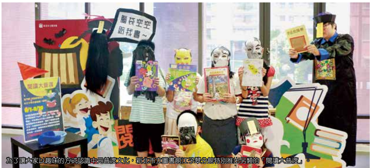
為了讓大家以趣味的方式認識中元普渡文化，新北市立圖書館江子翠分館特別推出另類的「閱讀大普渡」。

當傳統節慶與公共圖書館相遇，會激盪出什麼火花呢？現在就一起進入閱讀的創意世界一探究竟。