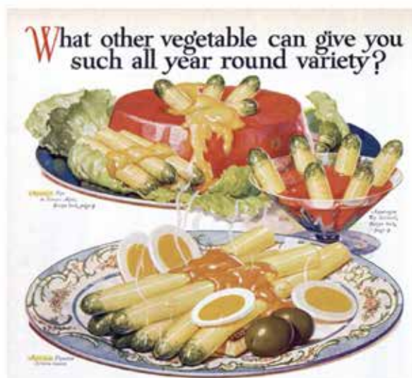
Good Housekeeping, 1928.