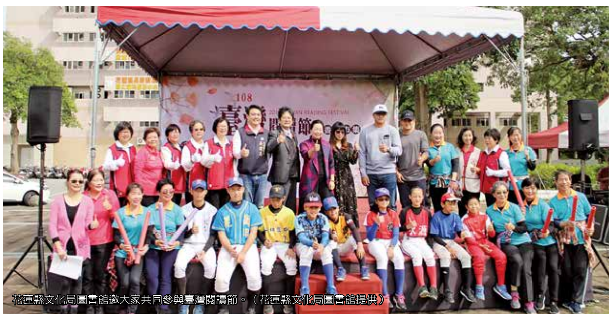
花蓮縣文化局圖書館邀大家共同參與臺灣閱讀節。

閱讀和旅行，可以讓生命更加美好。現在就出發到文學創作能量豐沛的花蓮旅行，以閱讀迎接2020年。