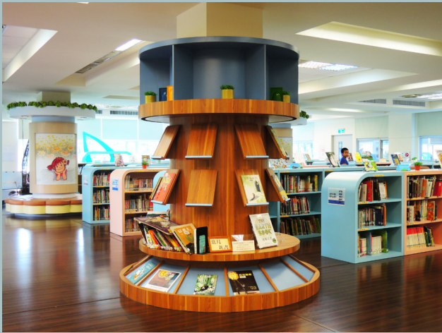
澎湖縣圖書館 一樓：兒童閱覽室