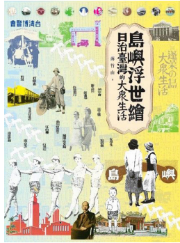
《島嶼浮世繪—日治臺灣與大眾生活》