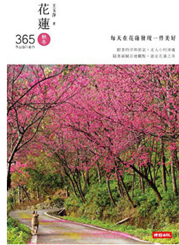
《花蓮 365 秋冬》