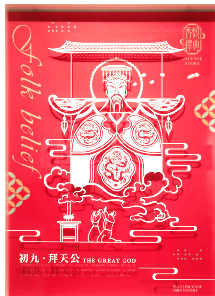
葉哲宇—香觀事物所-香文化海報設計