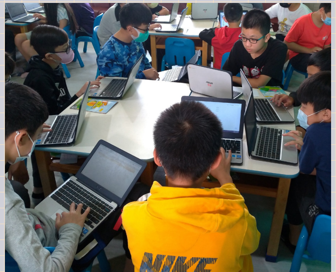
館外推廣，彰化僑信國小