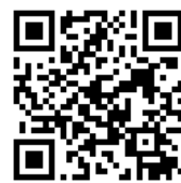
ilib Reader 閱讀說明

數位與網路科技促進電子資源蓬勃發展，不只改變了人們生活方式，也改變了人們溝通與閱讀的方式。數位內容如線上資料庫、電子書、數位教材、數位典藏等具即時互動與連結整合之功能，並結合文字、圖像與影音聲效等不同的設計元素，隨著各類數位資源的快速發展，帶來了閱讀的嶄新風貌；也讓讀者對數位資源服務的需求越來越迫切與多元。