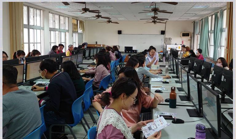
館外推廣，臺南安順國小