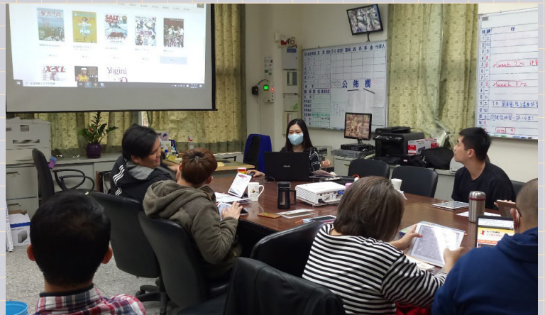
館外推廣，南投發祥國小

與時俱進的終身學習是擁抱世界的關鍵，數位學習力的提升是終身學習與自主學習的重要推手。廖科長表示：「數位閱讀其實不是要取代實體閱讀，而是依學習特性與需求來選擇閱讀的方式，可以有時候是實體有時是數位，或者二者互相搭配。」國資圖數位資源服務科以實體和線上課程相輔方向推動數位閱讀，讓數位資源自然成為民眾自主學習的使用資源，期待更多珍貴的數位資源能為民眾所使用，讓閱讀能量的傳遞持續發光發亮。