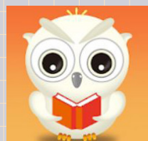
ilib Reader 國資圖電子書