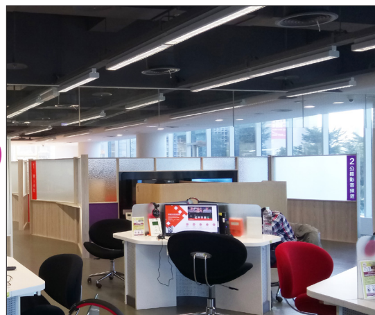
國資圖視聽個人雙人區