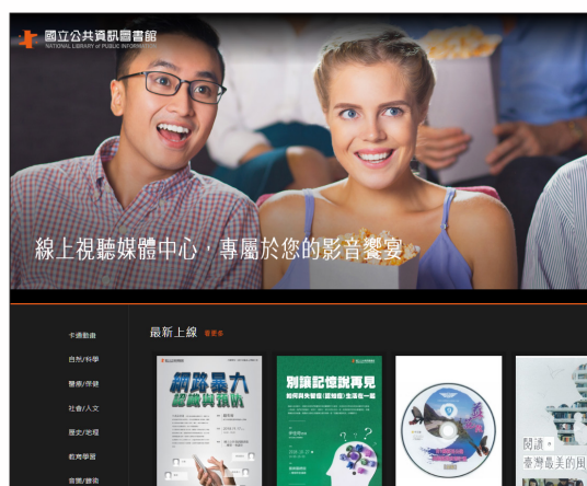
國資圖線上視聽媒體中心