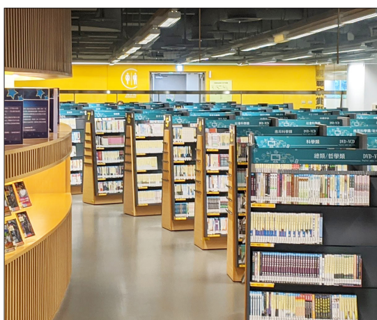
國資圖多媒體典藏中心

數位影音世代正在你我的閱讀生活中躍動新視野，本期介紹 AR 擴增實境互動圖書館、數位典藏電影館、行動影音 APP，跨越空間，走進新媒體及影音串流社群，圖書館 Youtube 頻道正式啟程，閱讀與學習更加趣味，豐富眼球與心靈。又如國資圖二樓設置【多媒體典藏中心】，提供 VCD、DVD、CD 及黑膠唱片等近 9 萬件家用及公播版之實體影音，及【視聽欣賞區】設有個人欣賞、雙人欣賞、團體欣賞與公播影音頻道等席位、黑膠小棧等服務，三樓【視聽室】每日播映主題電影，打造「影音閱讀小天地」，給予民眾與時俱進的多元內容。