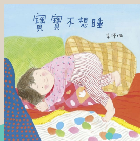
寶寶不想睡 文·圖/李瑾倫 信誼基金會出版