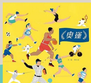
奧運 文·圖/陳又凌 聯經出版