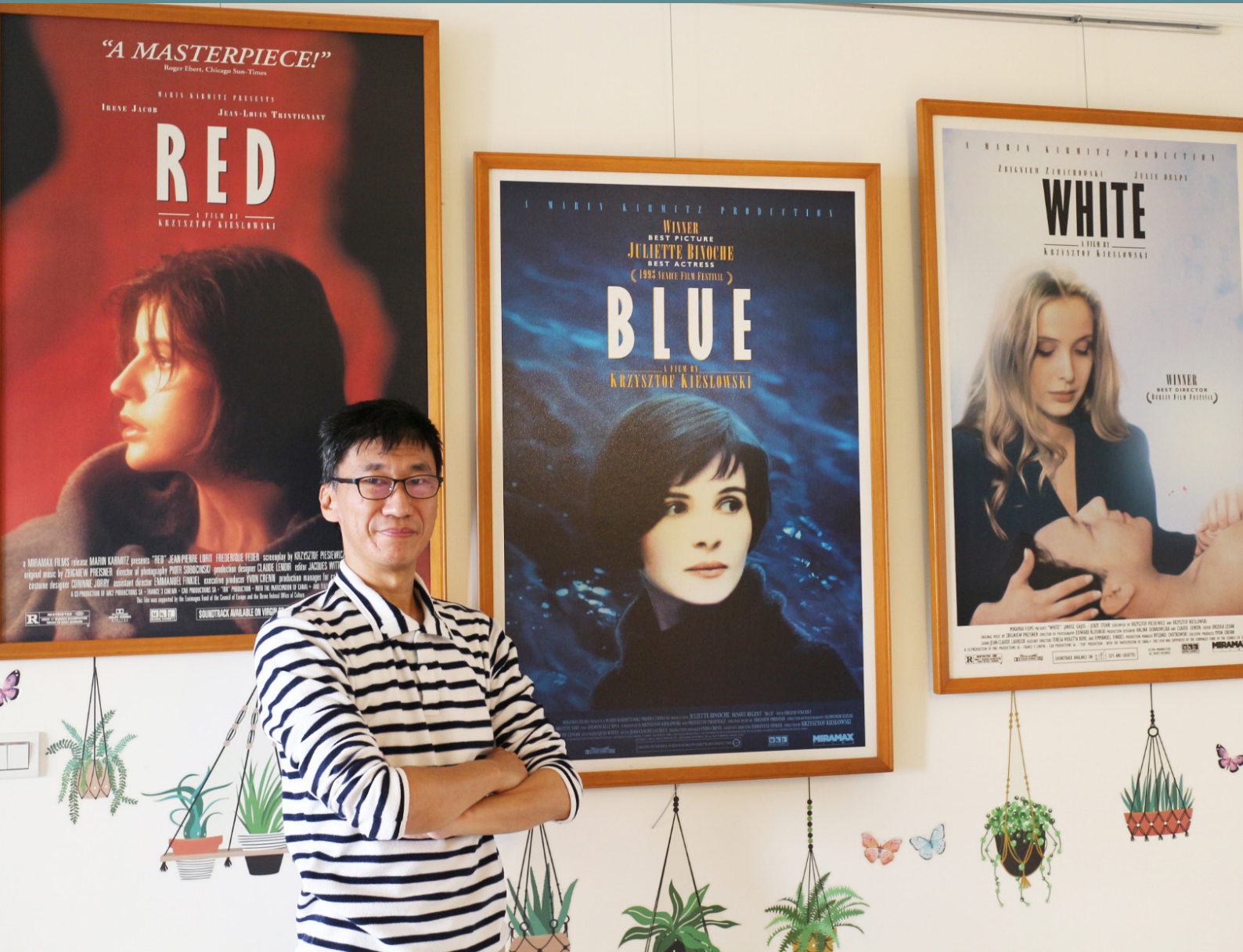
圖書館各式講座活動及影音館藏，是可以善加利用的豐富知識庫