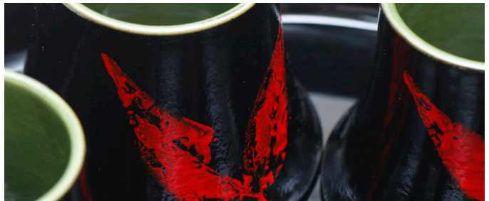
漆陶餐具組（局部）：臺灣漆文化博物館

如此多方而多元的呈現，想彰顯的正是工藝必要的在地風土性，這也是這場展覽很重要的目的——帶領民眾認識工藝文化是根繫地方人文風土。