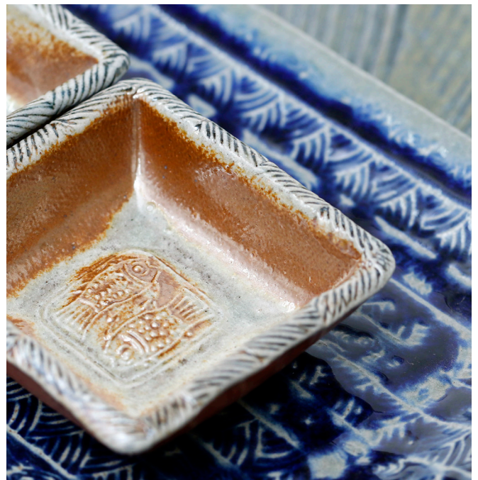
鹽釉燒印紋食器（局部）：寶來窯

特展參展的作品選件，泰國工藝以家具、燈具為主，在傳統工藝特色、實用性高兼具時尚設計，且著重手工著作的表現上，呈現識別度高的泰式風格。日本竹工藝則以燈具、生活器物為主，展現日式生活美學的設計。臺灣的選件，以具 200 年以上陶瓷產業之地方特色的經典陶瓷餐具為主，表現臺灣風土文化，以及能融合地方文化特色之品牌設計。