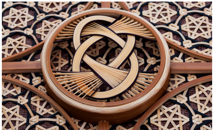
淡路收藏盒（局部）：駿河竹千筋細工 Suruga Takesensuzi Saigu