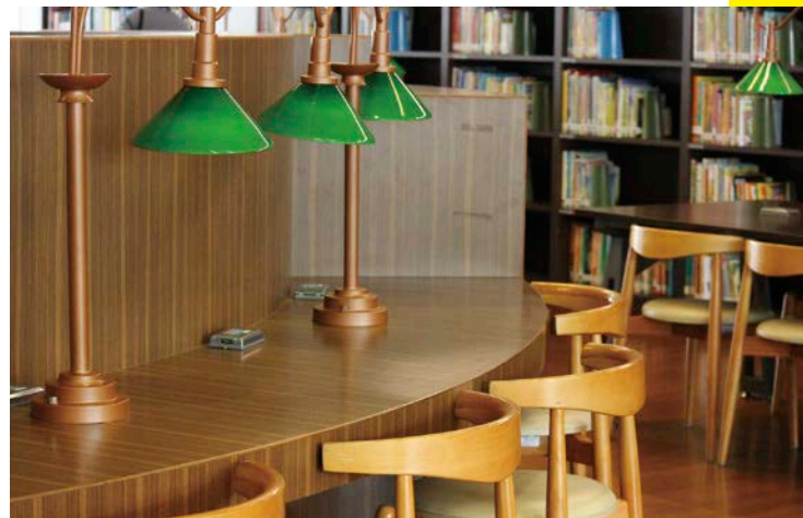
上圖：國立公共資訊圖書館以曲線流動牆面及水平窗帶設計，象徵知識之河在此流動匯聚。