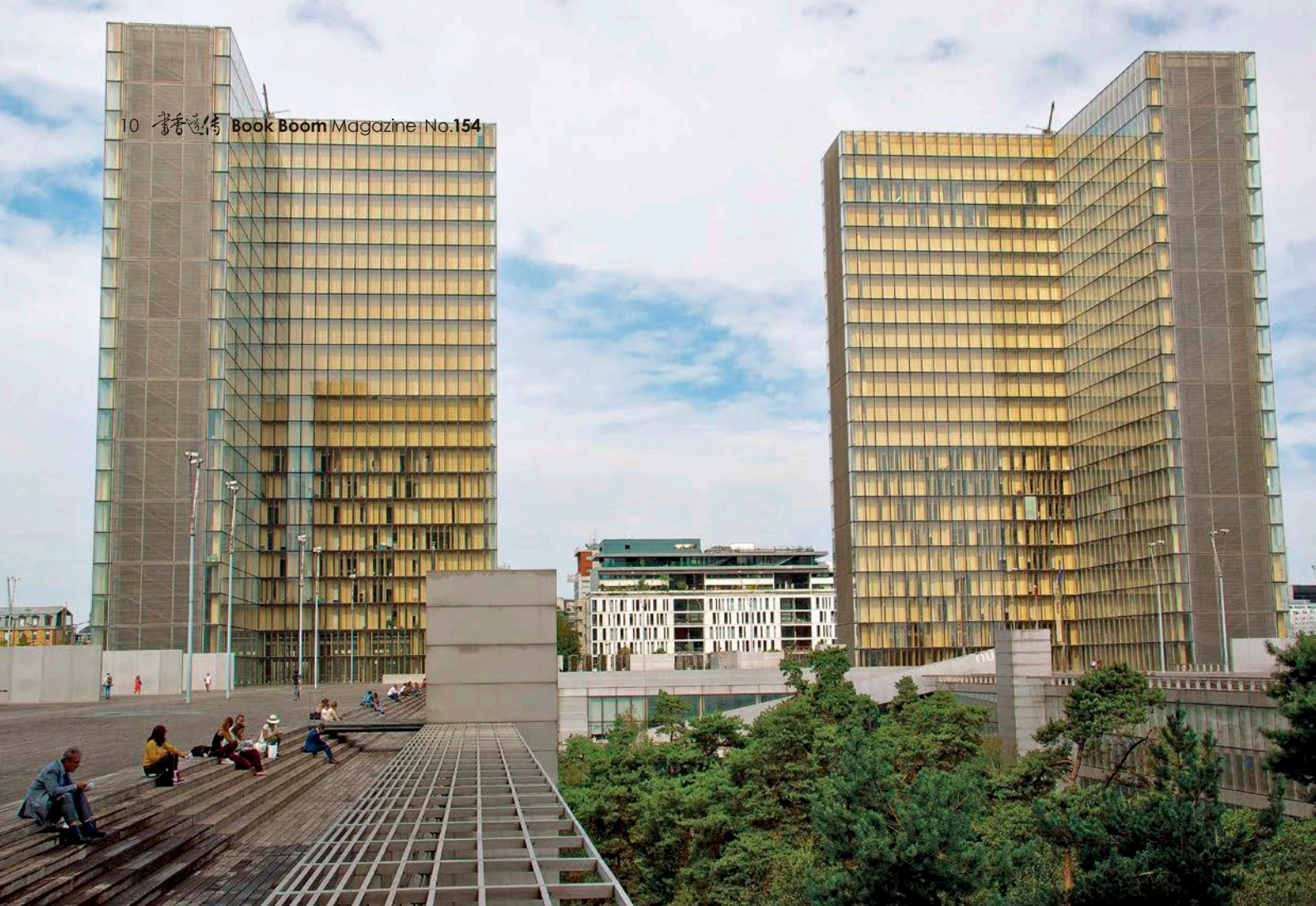
法國國家圖書館由 4 棟 L 形帷幕大樓構成，就像是 4 本打開的書。

張基義認為，公共圖書館不僅增進市民間的連結，也是城市的門面，提供與大眾溝通對話的平臺。像是位於法國巴黎左岸的國家圖書館，坐落於基地 4 個角落、高約 80 公尺的藏書塔，L 形的造形就像是 4 本打開的書；而 4 座塔圍繞的中庭廣場有 8 個足球場大，鋪著木地板、種植成細細高高的松樹森林，無論身處哪一棟建築物，都會被中庭的都市森林驚豔，圖書館建築外型恰如其分地象徵巴黎替世界打開通往知識的大門。