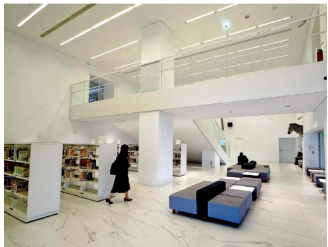
左圖、右圖：新舊建物融合的屏東總圖，閱讀空間現代感十足。