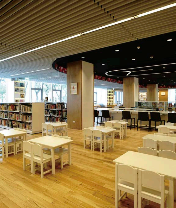
屏東總圖 1 樓設有兒童區，矮書櫃與桌椅皆專為兒童打造。