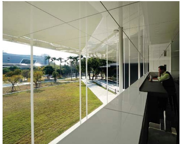
屏東總圖向自然借景，讓人感受書香與自然相融合的靜謐。