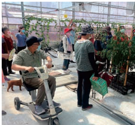
來到這座「不彎腰農場」，長輩不必忍受腰痠背痛，就能輕鬆摘採蔬菜。