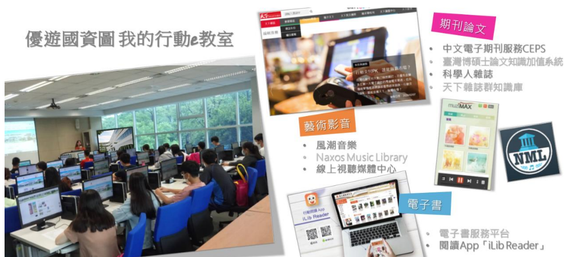
圖 3 學生上課情形

整體而言，此課程透過學生主動選課以及上課認真學習的狀況（如圖 3），展現學生主動積極的學習態度，透過課堂及課外的學習，必能累積及增進其個人的知識與常識，擴張學習的視野，而運用所學可以精進其生活的態度與技能。