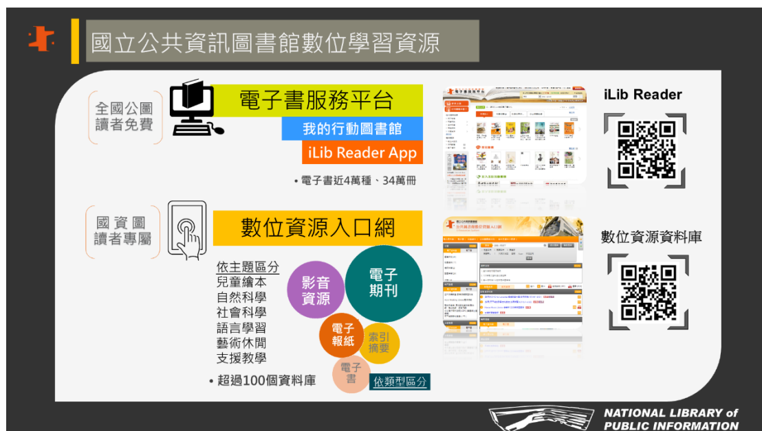
圖 1 國資圖數位學習資源平臺與資料類型