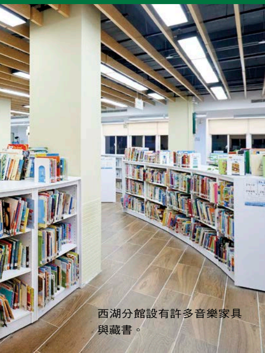
西湖分館設有許多音樂家具與藏書。