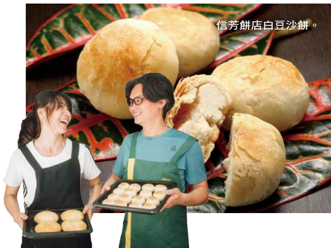
信芳餅店白豆沙餅。