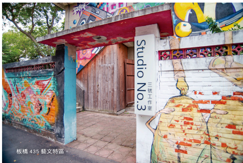
板橋 435 藝文特區。